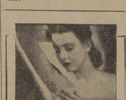
ARRID es la crema blanca, incolora, que no irrita.