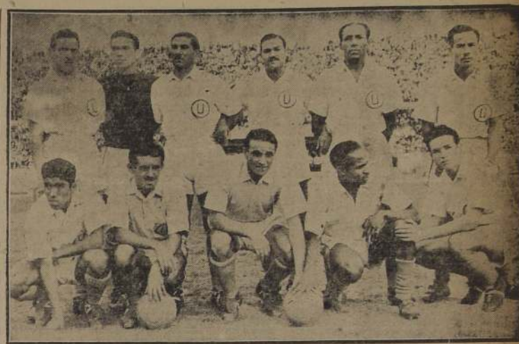
VENCEDORES. — Universitario de Lima que ayer se impuso con facilidad al Colo Colo, reforzado, por 3 tantos contra 0. Mejoraron los campeones peruanos en su segunda presentación, mientras que la defeción de los locales fue notable.

Después de la segunda presentación del campeón del Perú, se mantiene con justicia el interés y el deseo de que enfrente de nuevo a la selección universitaria al vencer el único cuadro — contando con los cracks extranjeros — que puede ponerlo en apuros y acaso si amagar seriamente sus posibilidades. Ha que agradecer, además, que los lineamientos, en sus exhibiciones futuras, deberán mejorar aún su rendimiento visto hasta ahora, por razones de aclimatación y de conocimiento del ambiente.