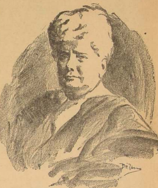
S. A. la Infanta Isabel

LONDRES, 23. — Desde el lunes próximo el precio del pan será aumentado en medio penique, quedando a 7 peniques las cuatro libras (1640 gramos). — (U. P.)