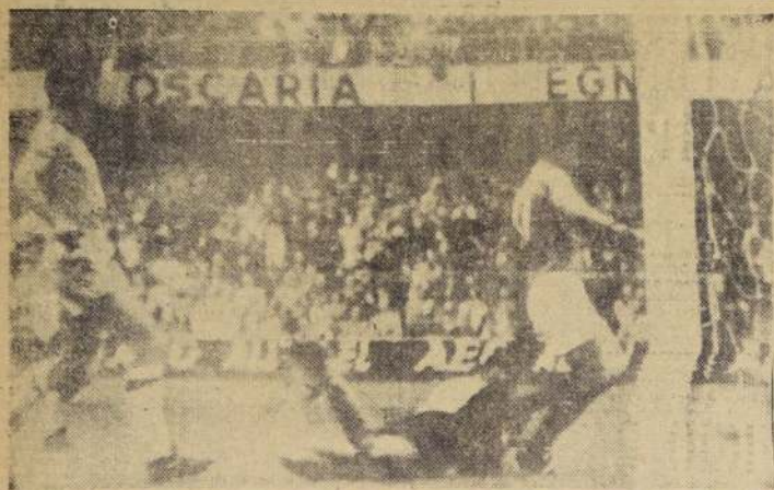
EL GOLEADOR EN ACCIÓN — Fontaine, el goleador del campeonato, conquista el primer gol de los franceses ante Brasil. Mañana se jugará el partido decisivo entre Francia y Brasil, que se jugará en el estadio de Maracanã, en Río de Janeiro, a las 14 horas.