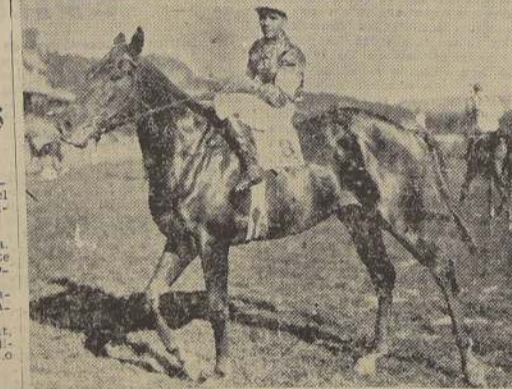
Limoges, la invicta hija de Maidstone, que dará gran brillo al clásico Cotejo de Potranas que se correrá el domingo próximo en el Club Hípico