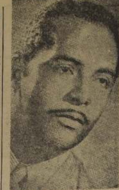
PEREZ PRADO, descubridor del mambo, actúa con su orquesta en "Perdida".

Una película de categoría es "Perdida", que la distribuidora "el Mex. anuncia para el martes en el cine Santiago. En efecto, a través de sus escenas, el espectador aprecia cuadros musicales y artistas que conoce a través de los discos, reunidos en una historia interesante. Entre los que tienen la responsabilidad de "Perdida", figura Ninón Sevilla, la orquesta de Pérez Prado, Los Panchos, Los Angeles del Inferno, Pedro Vargas, Agustín Lara y Domingo Soler.