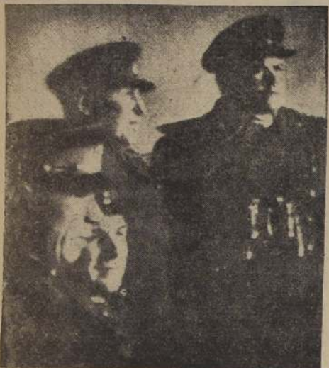
El general Vatutin, a la derecha, con tres oficiales de su estado mayor

Una Expresión Auténticamente Chilena en que Participarán los Mejores Exponentes del Campo Chileno