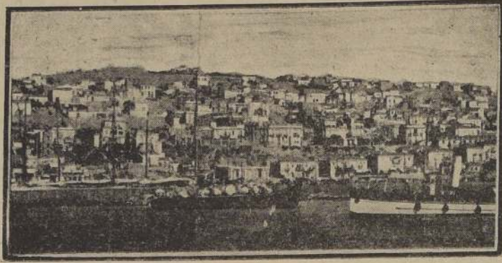
La bahía de Falero en el puerto del Pireo

El Times en un editorial, con este motivo dice que los regímenes nazi y japonés no respetan absolutamente ninguno de los artículos de la libertad y agregó: "Nuestros enemigos no están más bien batidos contra todos aquellos que hoy se arriesgan a la libertad humana: están peleando contra los que han resistido por la libertad y que a menudo mueren por ella durante más de 20 generaciones. Sus grandes y gloriosos ejércitos y sus muertes cayeron en la batalla, a veces en el patíbulo y a veces en fajas y desoladas prisiones. Sus ejércitos han podido sufrir derrotas, pero jamás se rindieron. Este es el verdadero significado de la Declaración de Derechos hoy día. Luchamos contra una ola de barbarismo que anulará muchos siglos de progreso".