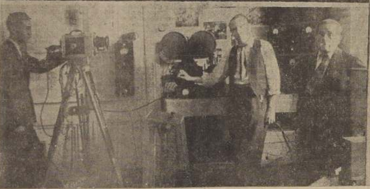
Algunos aspectos de la Exposición de los Trabajos del año, presentada por la Universidad "Santiago".

La Universidad Santiago, institución particular de estudios técnicos, puso ayer término a su año escolar, con una brillante presentación de los trabajos del alumnado de los diversos cursos.