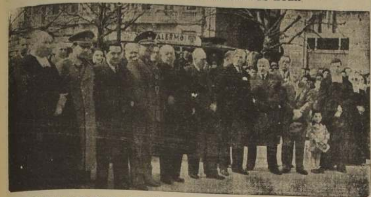
Al pie del monumento al Padre de la Patria, general don Bernardo O'Higgins, que se levanta en la avenida del mismo nombre, se efectuaron en la mañana de ayer diversos actos en homenaje al prócer, con motivo de celebrarse el aniversario de su nacimiento.

HOMENAJE DEL EJERCITO A las 9 horas delegaciones de jefes y oficiales de todas las unidades y establecimientos militares de la guarnición se congregaron frente al monumento para asistir a una breve ceremonia de recordación patriótica. A los acordes de los Himnos Nacionales de Chile, Argentina y Perú, fueron izadas las banderas de los países mencionados. HOMENAJE DE LOS TALLERES DE SAN VICENTE A las 11 horas llegaron hasta el monumento al prócer alumnos de los Talleres de San Vicente, encabezados por la banda del