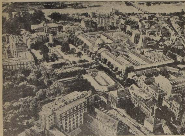
Vista aérea de Vichy

Franco-americanos avanzaron 40 Kmts. en el sur, y llegaron a Aix a 17 Kmts. de Marsella