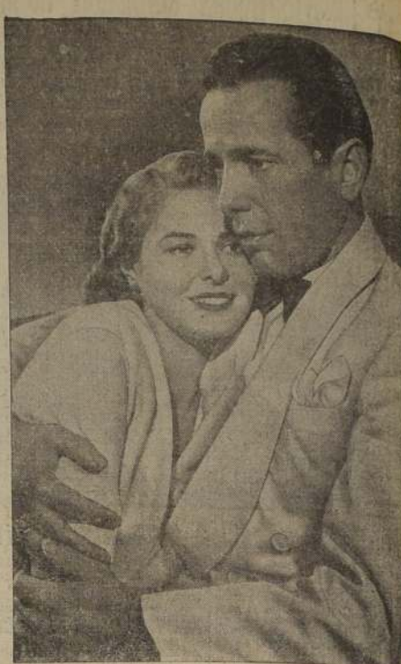
Una escena de la gran producción Warner Bros. "Casablanca", que protagonizan Humphrey Bogart e Ingrid Bergman, película que ha sido considerada como la mejor del año, y que será estrenada muy pronto en nuestras pantallas.