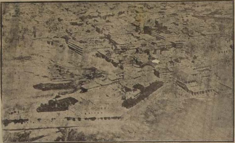
VISTA AEREA DE LA CIUDAD DE PANAMA

En la noche será huésped de honor en una comida que le ofrecerán el Presidente Jiménez y señora.