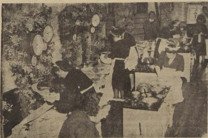
DURANTE EL CONCURSO