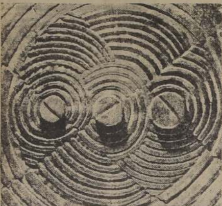
Decoración mural, realizada por R. Delaunay, a base de caseína y arenas coloreadas

así, perdiste el mal entendido entre la imagen oficial, que se hace de sí la Francia, y las fuerzas vivas que ella engendra e inspira. Peró la vida reconoce, al fin y al cabo, a los suyos, y Delaunay, con su franqueza vigorosa y popular, la alegre robustez de su aspecto, su acento arrabalero, su ardor, su coraje y su inocencia a las grandes obras, es un artista puro y un puro artesano francés.