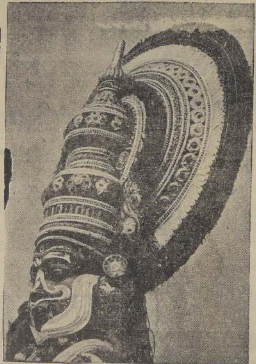
Esta es la máscara de Ravana, el rey demonio de Lanka. Es una de las más magníficas piezas del templo de las danzarinas de Malabar.