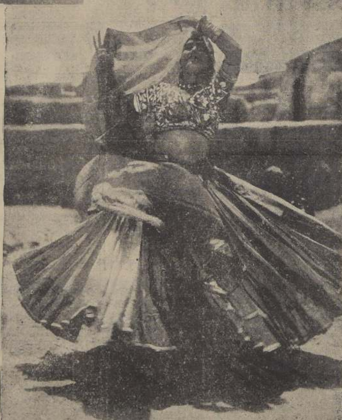
Un tipo de danzarina hindú que se presenta en las ocasiones festivas. Estas danzarinas nunca son profesionales.