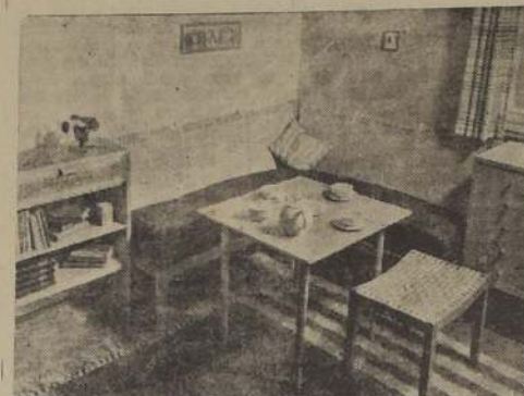
Rincón comedor, constituido por seis piezas de moblaje