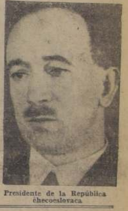
Presidente de la República checoslovaca