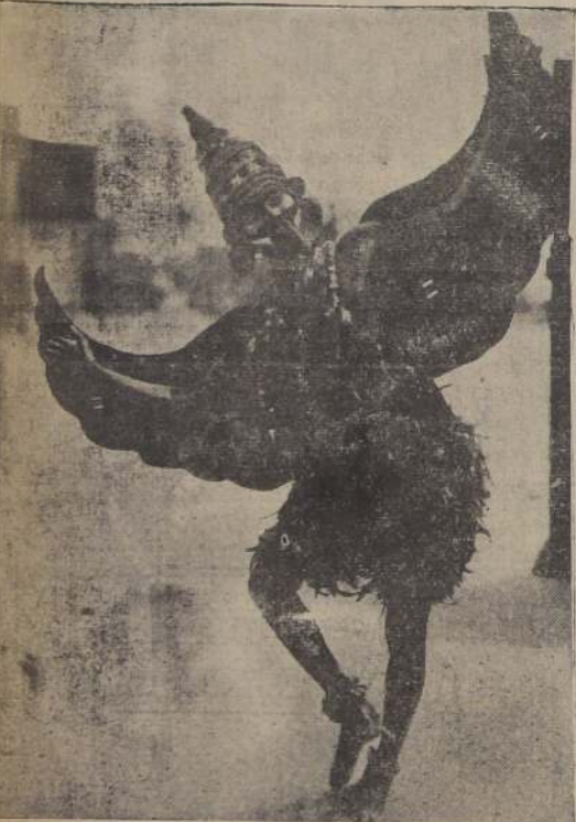
Garuda, el pájaro con las alas de fuego, aparece en todos los grandes templos de danzas de la India del Sur. Es considerado como un símbolo de Vishnu el Preservador, una especie de brazo derecho del dios.