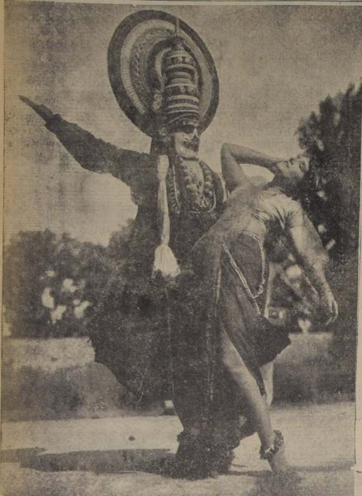
En este templo de la danza de Malabar vemos al rey demonio Ravana ejercitando su poder sobre Sita, esposa de Rama, séptima encarnación de Vishnu.