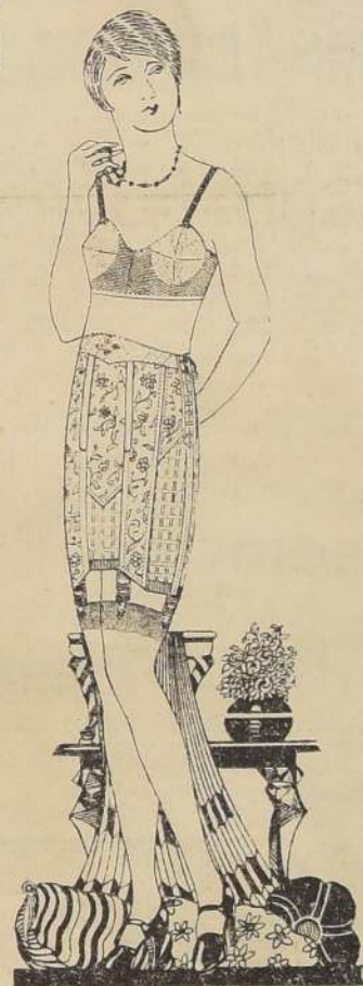
FAJA Elástica NIRVANA

SOLO POR ESTA SEMANA EN NUESTRAS DOS CASAS, CON LOS MEJO- RES MODELOS PARA LA MODA ACTUAL