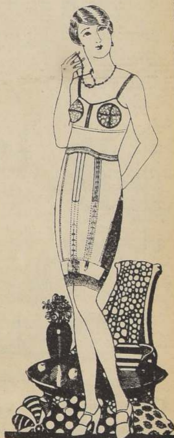
FAJA NIRVANA 22

NUEVO Y ESPLENDIDO MODELO, da a la si- lueña un sello de gran distinción, combinada en ricos géneros, bro- che y elásticos de se- da, a ..... $