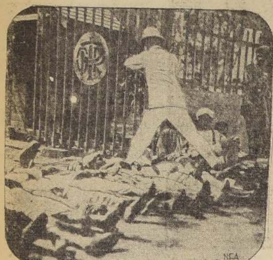
Un grupo de partidarios de Gandhi, tendidos ante la entrada de una estación de ferrocarril, en Bombay, para impedir el paso del público. En la foto se ve a un funcionario inglés de dicho ferrocarril, saltando por encima de los cuerpos.