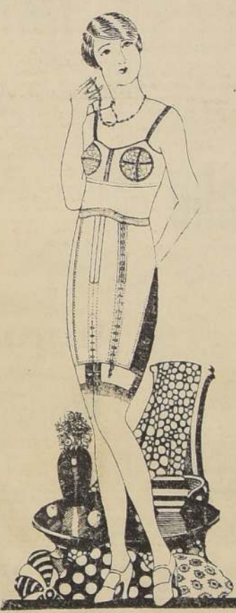
FAJA NIRVANA 107

MODELO muy reductor de estómago y cade- ras, con pequeños es- tuches de elásticos en los costados. Largo, 40 cms. En fina tela de seda, a ..... $