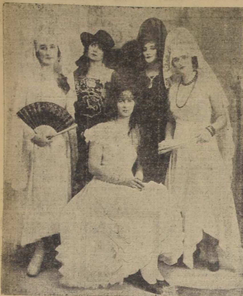
Las Cortes del Viejo Continente se ocuparon, hace algunas semanas, del matrimonio de la Princesa Ileana, hija de la Reina María de Rumania, con el Conde Alexander de Pless, de nacionalidad alemana. Se-

ILEANA DE RUMANIA, LA EX-NOVIA DEL CONDE DE PLESS.—