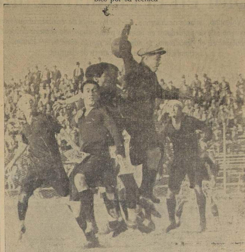
De este entrecruzamiento resultó el goal de los italianos, que el árbitro anuló por hands. En realidad la confusión de jugadores nos ocho por lo menos los que se ven, se prestaba para hacer una diablura que bien podía pasar inadvertida para el árbitro