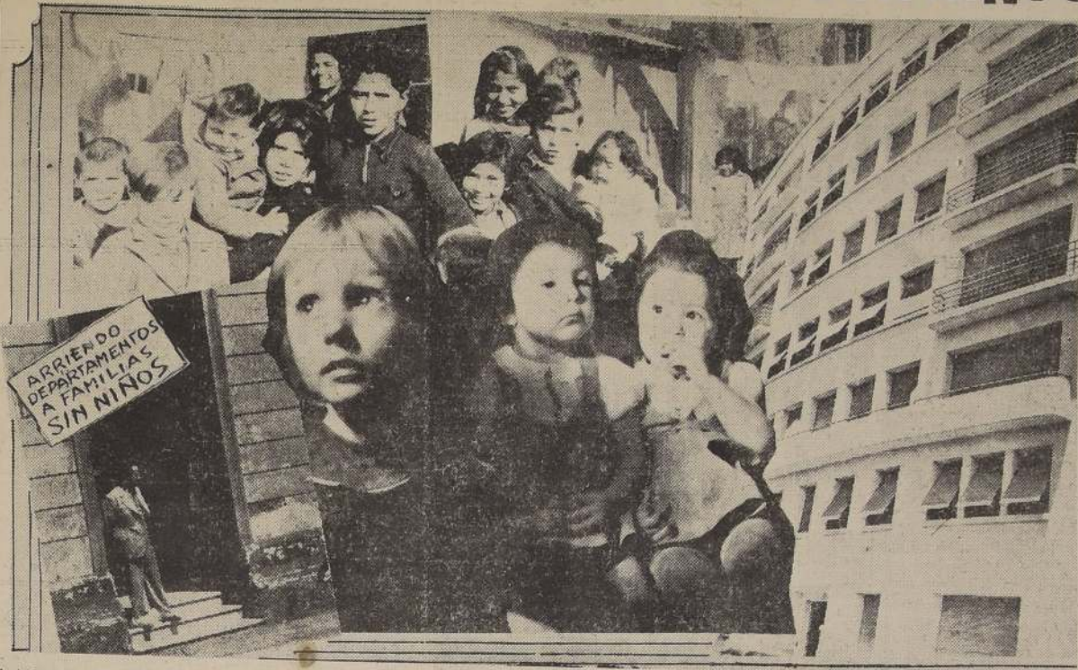
A todos los niños afecta la determinación de los dueños de propiedades. — En el edificio moderno como en el conventillo, se niegan a recibirlos.

No obstante esto, la medida que comentamos sigue aplicándose, y tanto en las oficinas de los corredores de propiedades como en los avisos en los diarios y los que se colocan en las puer-