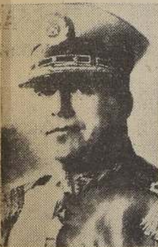
Director General de Carabineros, señor Oscar Reyes Leiva.

S. E., Ministros de Estado y personalidades han sido invitados al almuerzo en el Estadio de Carabineros.—Romería a la tumba de los fundadores