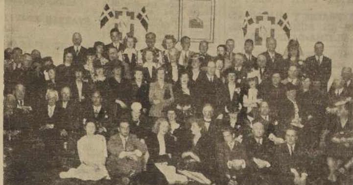
Almuerzo ofrecido en el Crillon por el Ministro de Dinamarca a la Colonia Danesa, con motivo de celebrar el aniversario de su país.