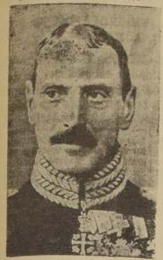
s. M. Christian X, Rey de Dinamarca, que celebra hoy el 74.º aniversario de su nacimiento.