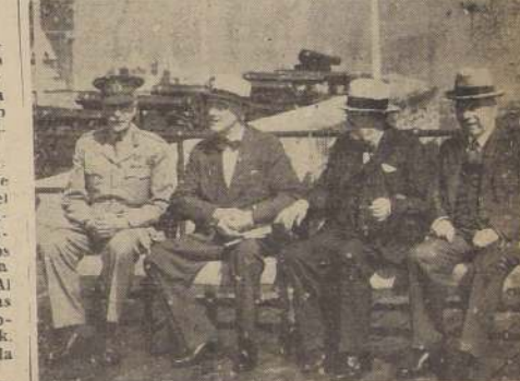
Esta fotografía, de las figuras principales de la Conferencia de Quebec, fue tomada en una de las azoteas de la Ciudadela, residencia del Gobernador General de Canadá, el Earl de Athlone. De izquierda a derecha, Lord Athlone; el Presidente de Estados Unidos, Mr. Franklin D. Roosevelt; el Primer Ministro de Gran Bretaña, Mr. Winston Churchill, y el Primer Ministro de Canadá, señor Mackenzie King