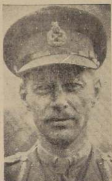
El general Dempsey comandante del Segundo Ejército inglés. Todas las tropas de G. Bretaña y su Imperio que están combatiendo en el frente occidental se encuentran bajo el mando del Mariscal Montgomery