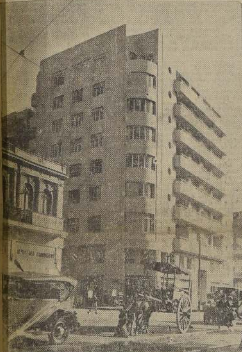
Vista del hermoso y moderno edificio de la Caja de Retiro y Previsión Social de los FF. CC. del Estado, que se inaugura hoy

Programa de festejos con que se celebrará el 25.º aniversario de la institución