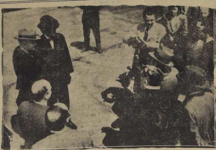
La atención mundial se concentra sobre la reunión de Cancilleres que se realiza en París. En la foto aparece el señor James Byrnes con los senadores Vandenberg y Connally.