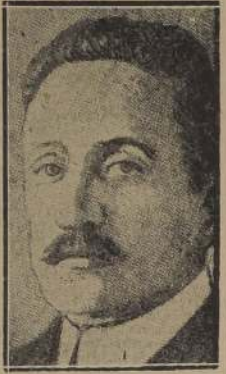
Enrico de Nicola, Presidente Provisional de la República Italiana.

El destructor recibió daños de gravedad y pudo dirigirse a puerto por sus propios medios, y no hubiera bajas a su bordo.