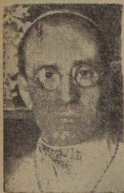
S. S. Pio XII