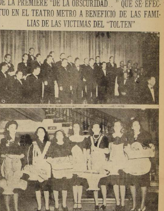
Entre los diversos aspectos que presentaba el Teatro Metro, durante el desarrollo de esta gran velada, enfocamos al Coro Yugoslavo "Iadrani" y a un grupo de distinguidas señoras de la colectividad británica, que cooperaron gentilmente al mejor éxito de este beneficio.