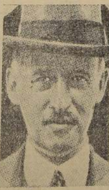
Mr. Henry L. Stimson

DECLARÓ ayer a la prensa el Secretario de Guerra de la Unión, Mr. Henry L. Stimson.