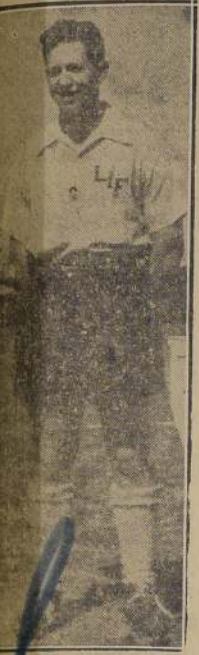
GUSTAVO ZAROR REYES