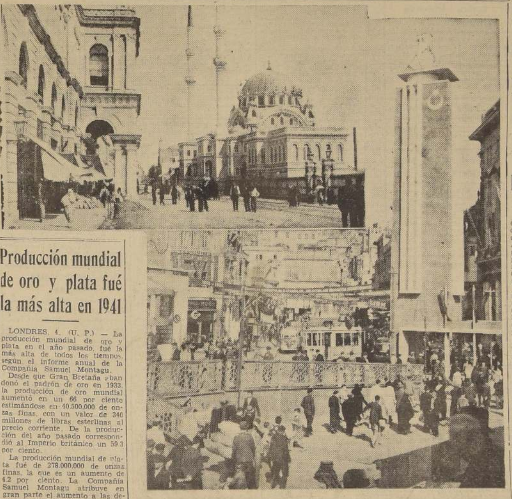
Algunos aspectos de la vida cotidiana en Angora, la capital de Turquía que posiblemente y dentro de muy poco se vea perturbada por los estremecimientos de la guerra.

Churchill y el Embajador nipón en Londres Shigemitsu discutieron acerca de las relaciones entre ambos países y los problemas del Oriente. — Francia aceptó plan de mediación nipona en sus diferencias con los tailandeses "bajo la presión de la fuerza".