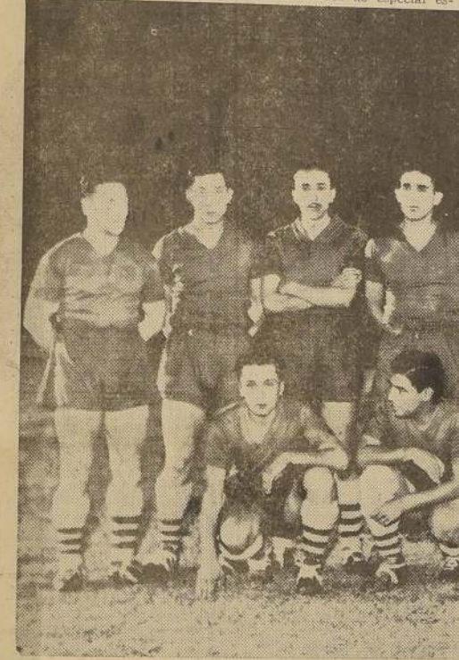
El seleccionado chileno cumplió anoche la mejor de sus actuaciones en el Campeonato Sudamericano de Football. Lleno de empuje, aunque siempre carente de técnica, luchó con su formidable adversario de igual a igual y hubo momentos en que lo dominó

Setenta mil personas acudieron anoche al Estadio Nacional, con motivo de la última reunión del Campeonato Sudamericano de Football, en la que actuaron los cuadros representativos de Argentina y Chile, match que logró caracteres de especial es-