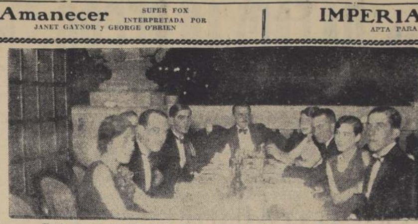
En la terraza del Club de la Unión, durante la celebración del Año Nuevo