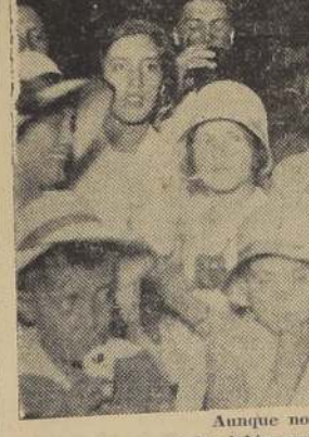
Aunque no sea de tono, a los labios me lo llevo. Y como es "cola de mono" Salud! Por el Año Nuevo!

En el día de ayer, el Ministro de Relaciones Exteriores recibió felicitaciones de los señores Ministros de Estado, Sub-Secretarios, altos funcionarios públicos y Jefes de la Armada y del Ejército.