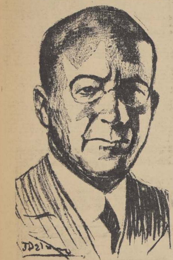
El General Moncada, nuevo Presidente de Nicaragua

MADRID, 1.º.—Al comenzar el calendario del nuevo año, el período durante el cual ha permanecido el frente del Gobierno el generalísimo de Rivera, entra al segundo trimestre de sus seis años de existencia. Desde enero del año pasado, uno de los más importantes acontecimientos en la política exterior fue el ingreso de España a la Liga de las Naciones. En 1928 el Gobierno decidió dejar de pertenecer a la institución de Ginebra, porque se le rehusó a España un asiento permanente en el Consejo. En realidad, como lo dijo el primer ministro en su respuesta a la invitación de la Liga para ingresar nuevamente a esa institución, España jamás ha dejado de colaborar a ella, manteniendo representativa en la Oficina del Trabajo, en la de Cooperación Intelectual, etc. Seguro de obtener el asiento semi-permanente que se le ofrecía, el Gabinete decidió aceptar entrar nuevamente a cooperar en forma completa con la Liga sin condiciones o reservas.