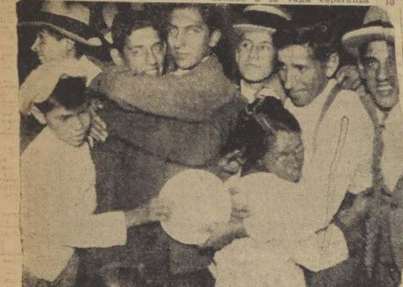
El Año Nuevo ha dejado un recuerdo caro y tierno: Vió abrazarse a dos cuñados y a una suegra con su yerno.