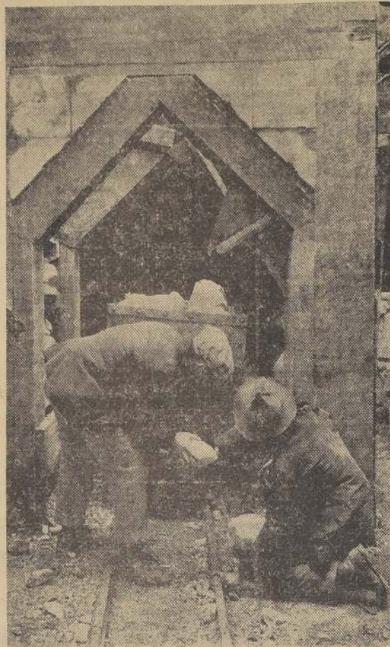
Reconstitución de una escena de mutilación: la "víctima" colocaba un dedo sobre el riel, y el mutilador se lo trituraba de un fuerte golpe.

MIL SETECIENTAS SESENTA CAUSAS FALLADAS EN EL AÑO. — ECOS DEL CELEBRE PROCESO DE LOS MU