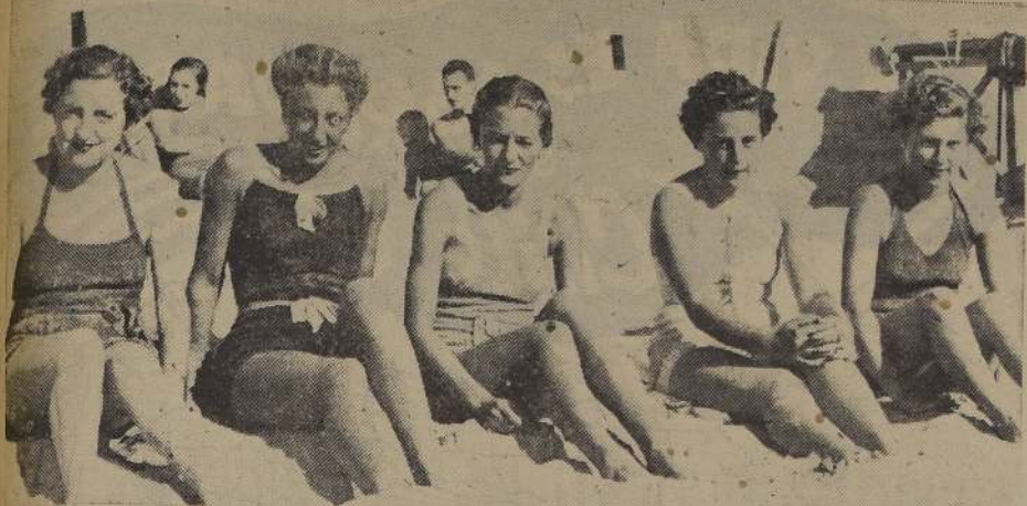
Un simpático grupo de bañistas en la playa de las Salinas