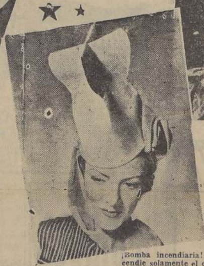
¿Bomba incendiaria? Ojalá que incendie solamente el corazón de algún guardia de asalto nazi