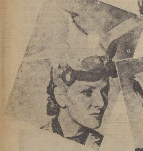
Nuestras abuelas, a falta de una paloma de la paz, llevaron una paloma en el sombrero; esta rubia berlinesa lleva un avión de caza