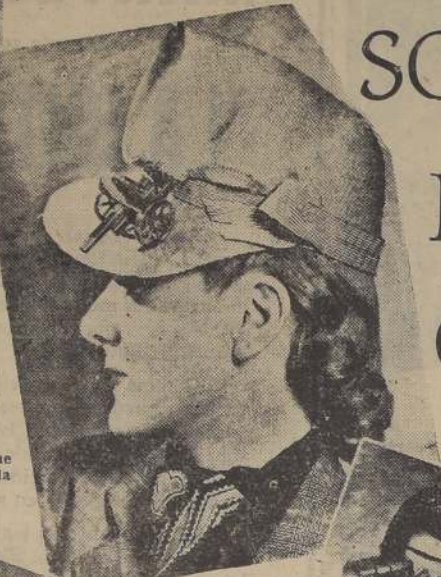
Un "Gran Bertini", pieza de artillería pesada cuelga sobre la cabeza de esta especie de tienda de campaña.