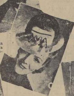
¿Torre cuádruple de acorazado? Este fieltro blanco lleva en la colección el nombre de modelo "Linea Siegfried"