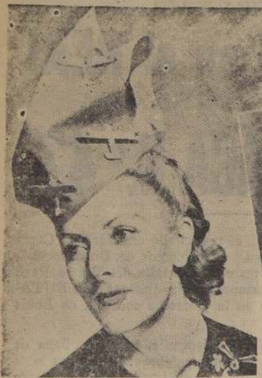
Sobre esta cabeza rubia aterrizan aviones que a pesar de la cruz (swástica) no tienen nada de angelical