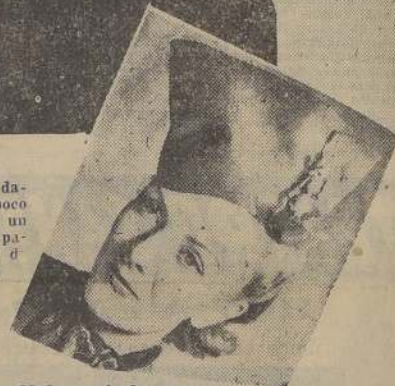
Un soldado en pie de guerra sobre la cabeza. ¿Significa también ruido de botas en el corazón?

Las mujeres son, indiscutiblemente, mucho más audaces de todo cuanto uno pueda imaginarse. El sombrero femenino ha pasado todos los límites, y ahora ya no puede decirse que sea siem-