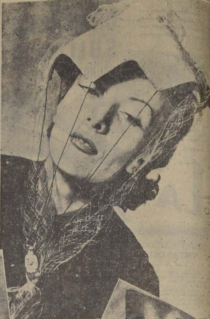
Menos mal que esta dama de rostro un poco romántico, escogió un paracaídas, con su paracaídas, en lugar de armas ofensivas