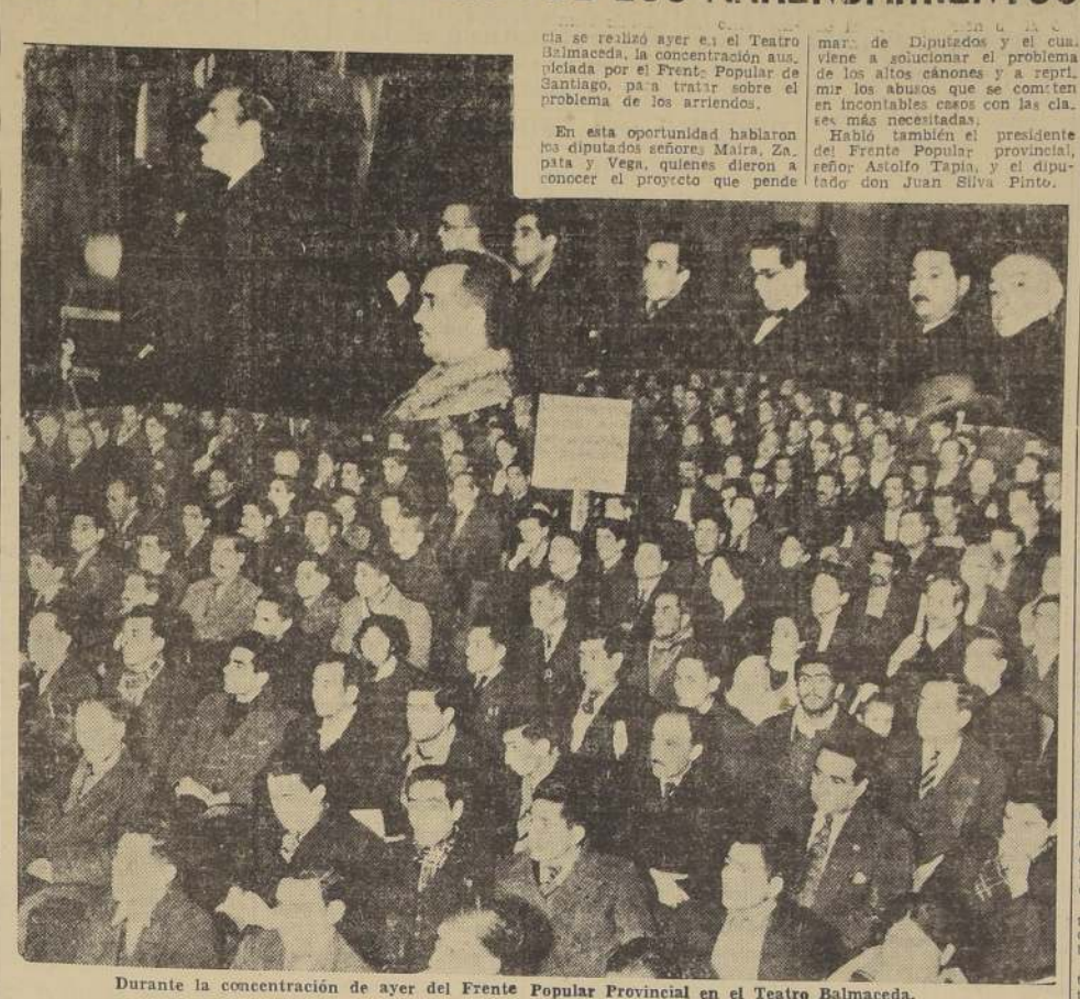
Durante la concentración de ayer del Frente Popular Provincial en el Teatro Balmaceda.