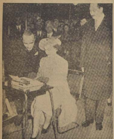
La Duquesa de Gloucester, probando una de las máquinas de escribir más pequeñas del mundo, durante la visita que efectuó, en compañía del Duque, a la Feria de Industrias Británicas. Esta es la primera vez que la Duquesa usa una máquina de escribir.