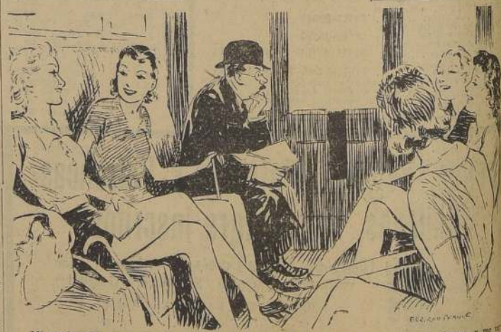
Mi mujer me espera en la estación. Será mejor que toque la campana de alarma, y me vaya a pie desde aquí.