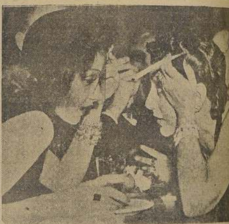
Martene Dietrich, a la izquierda y la señora de Mr. Jack Warner, (de la Warner Bros.), conversan animadamente en un momento nocturno de Hollywood.