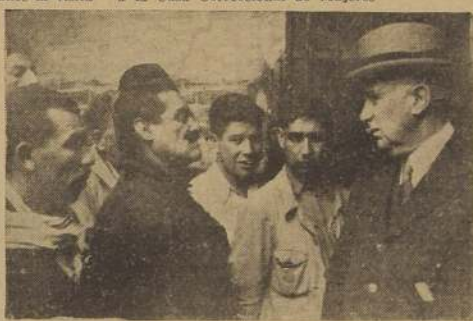
El presidente de la Corte Suprema escucha los reclamos de algunos reos de la Cárcel Pública