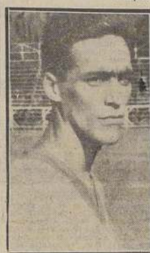
CAPITAN.— Heleno, que ayer capitaneó el equipo de Brasil, que se clasificó vicecampeón sudamericano de fútbol.

BUENOS AIRES 10.— (Agence France Presse).— Una vez más Argentina ha conquistado con todos los honores y merecimientos, el título de Campeón Sudamericano de Fútbol.