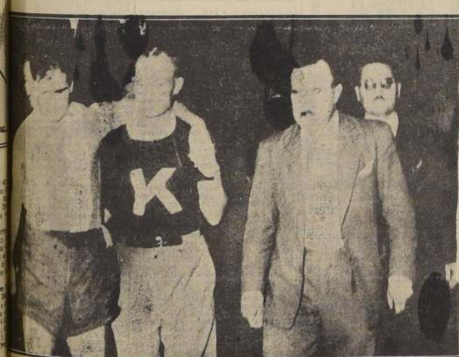
El Campeonato Sudamericano de Fútbol, realizado en el Estadio Monumental de River Plate, en Buenos Aires, se suspendió por espacio de 70 minutos, a causa de un foul de Chico en contra de Salomón, que motivó la entrada del público a la cancha. — DEBIERON INTERVENIR ESCUADRONES DE POLICIA. — MEN DEZ FUE EL AUTOR DE LOS DOS TANTOS

abandonar el campo de juego a causa de una lesión. En el grabado, puede verse en los momentos en que se sacó del "field" por miembros de la delegación de su país.