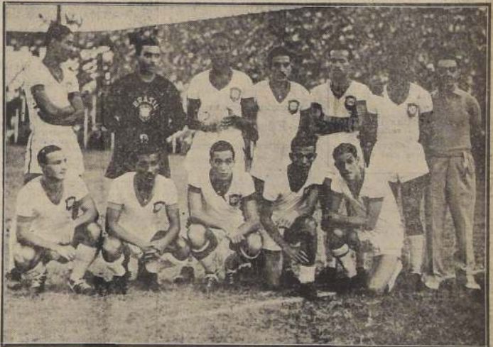
VICECAMPEONES.— Jugadores que integraron el equipo de Brasil, que obtuvo el segundo puesto en el Sudamericano. Tercero fue Paraguay, cuarto Chile y Uruguay y sexto Bolivia.