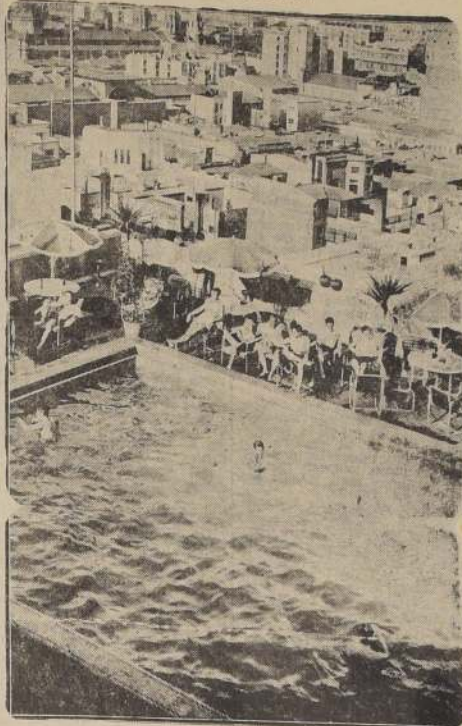
Aspecto parcial de la piscina ubicada en el 17.º piso del Hotel Carrera.