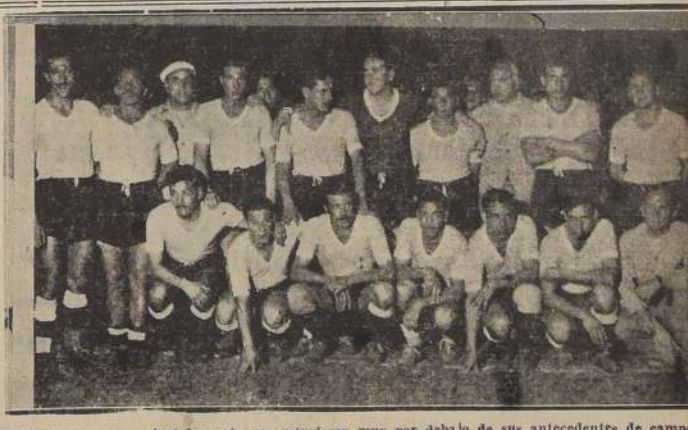
URUGUAY.— Los orientales, esta vez estuvieron muy por debajo de sus antecedentes de campe- nes del mundo y de ocho veces campeones sudamericanos. Ha decaído visiblemente la calidad del fútbol uruguayo.

En toda actividad, vence el que aporta algo nuevo, el que innova, no el que plagia, ni el que se conforma con lo de siempre. CHILENOS Y URUGUAYOS Quedaron cuartos en este Campeonato y en empate, pe- ro lo cierto es que se trata de una igualdad que perjudica a nuestra representación. Chile trajo una delegación débil y hasta sin aspiraciones, por la misma razón, pero se operó en el cuadro una reacción saluda- ble y que conforma: se man- tiene la pujanza del juego criollo y la porfía ante la evi- dencia de la derrota. Siempre fueron así nuestros selecciona- dos, desde los tiempos de Ma- nuel Guerrero hasta hoy, en que asoma y preocupa la au- sencia de valores de calidad. La crítica argentina ha teni- do más bien conceptos elogio- sos para los chilenos, pues des- tacan en ellos la intención y el hábito de practicar un fút- bol moderno, cercano al me-