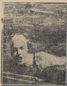
Ann Curtis, la mejor nadadora de Estados Unidos.