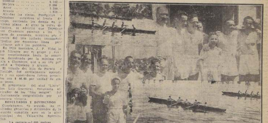
Llegada de la final de 1.200 metros. Equipo argentino vencedor. Llegada de la final de 1.500 metros, equipo argentino vencedor.

LOS REMEROS ARGENTINOS VENCIERON HOLGADAMENTE A SUS RIVALES EN LAS REGATAS INTERNACIONALES. — UNA CONCURRENCIA DESBORDANTE ACUDIO A PRESENCIAR LAS DIFERENTES PRUEBAS INTERNACIONALES DEL REMO. CORRIDAS EN LA MAÑANA DE AYER EN LA BAHIA DE VALPARAISO. — LOS MALECONES SE VIERON TOTALMENTE OCUPADOS POR LOS ESPECTADORES. — LOS RESULTADOS