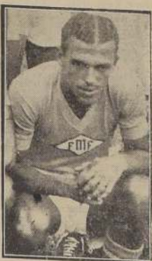
JAIR.— El "artilero" del día, Jair, quien hizo un pase a Labruna, y este avanzó de inmediato por el campo brasileño, pero el ataque fue contenido por un zaguero argentino, echando a perder el partido.

El partido se desarrolló en un ambiente de gran tensión. Los jugadores argentinos, que habían sido recibidos en el Estadio Monumental de River Plate, se enfrentaron a los jugadores brasileños, que habían sido recibidos en el Estadio de la Gárgola.