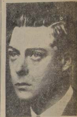
El Duque de Windsor

LONDRES, 4. (U. P.).— El Duque de Windsor llegó a Inglaterra por vía aérea el viernes.