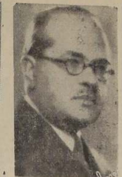
Excmo. señor Oscar Carmona, Presidente de Portugal, país que celebra hoy el 35.º aniversario de la República.