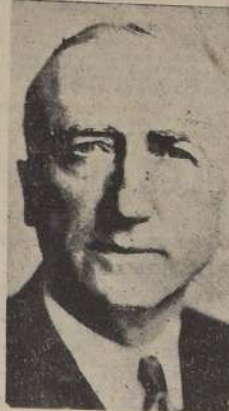
J. F. BYRNES

WASHINGTON, 4.—(U. P.).— El Secretario de Estado, Mr. James F. Byrnes, pronunció el discurso radiotelefónico dirigido a toda la nación, en el que habló sobre la primera conferencia sostenida por el Consejo de Ministros de Relaciones Exteriores en Londres.