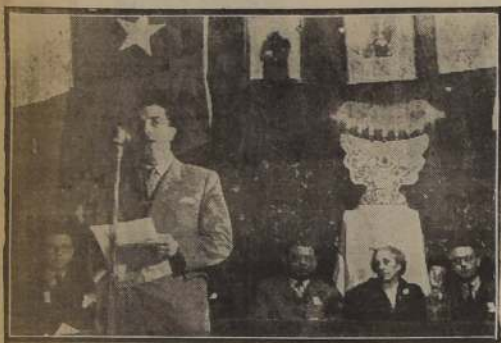
El senador don Gabriel González Videla, pronunciando su interesante discurso

En el acto realizado con motivo de la celebración del 25.º Aniversario del Fondo Pro Reconstrucción de Palestina, uso de la palabra el Senador Gabriel González Videla, presidente del Comité Chileno Pro Palestina Hebreo, quien, entre otros conceptos, expresó lo siguiente: "Es profundamente significativo que el acto que hoy se celebra tienda a realzar las conquistas logradas por el trabajo constructivo y pacífico, justamente en una época que se ha caracterizado por el dominio de las fuerzas de destrucción y aniquilamiento del progreso humano".