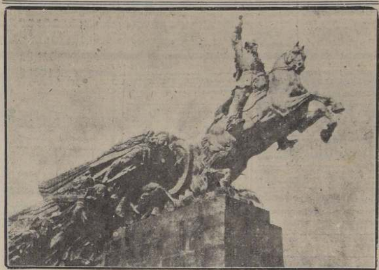
Monumento al Libertador Simón Bolívar en la ciudad de Quito, ubicado al comienzo de la Avenida 18 de Septiembre en el parque de la Alameda, al pie del cual el Presidente de la República de Chile depositó ayer una ofrenda floral

La policía mantiene una estricta vigilancia de toda la ciudad, en la que a estos momentos reina la tranquilidad. Mientras tanto todas las Facultades de Buenos Aires continúan en la