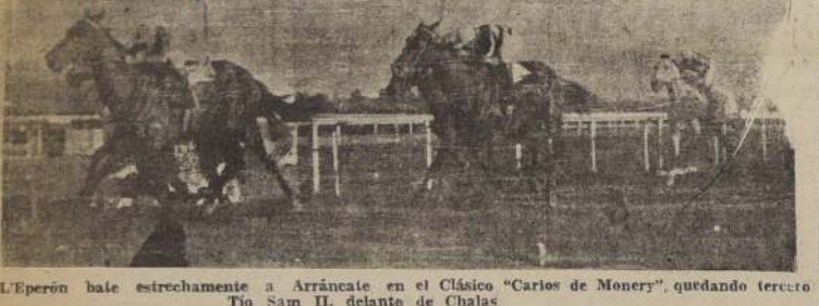
Eperon bate estrechamente a Arrancate en el Clásico "Carlos de Monery", quedando tercero Tio Sam II, delante de Chalas

Cubiertos los primeros tramos de la recta, Tempestuoso dominó a Bárbaro, pero luego decayó en su acción y Bárbaro recuperó su situación de privilegio, viéndose luego amagado por Macanudo.