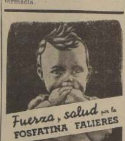
Fuerza, salud y FOSFATINA FALIERES

FIXODENT, un polvo mejorado para polvorizar las dentaduras postizas, las mantiene más firmemente en la boca. No se desprenden ni mueven o caen. FIXODENT no da ninguna sensación desagradable. Es alcalino (no ácido). No irrita la boca. Contrarresta el "olor a dentadura postiza". Suaviza el aliento. Obtenga FIXODENT en cualquier farmacia.