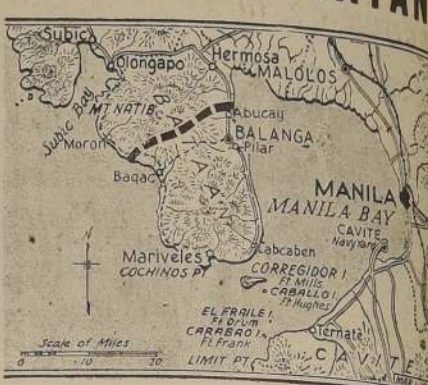
El frente de Bataan. La línea cortada señala el frente en el combate actualmente japonés y americano

WASHINGTON, 6 (U. P.)—El Departamento de la Guerra dio a conocer esta tarde el siguiente comunicado: "Zona de Filipinas.—Se está librando una salvaje lucha en Bataan, donde las tropas del general Wainwright resisten energicamente los ataques de las fuerzas niponas." "Durante el día el enemigo logró algunas ventajas, pero a costa de enorme pérdida de vidas. El ataque fue apoyado por la artillería y bombarderos en picada. Un avión enemigo fue derribado." "En la costa este, la artillería enemiga emplazada en baterías, hizo fuego de hostigamiento contra nuestras defensas de la orilla. En su mayor parte, los proyectiles no dieron en el blanco." "No hubo hoy ataques aéreos contra la isla del Corregidor." "No hay que informar de otras zonas."