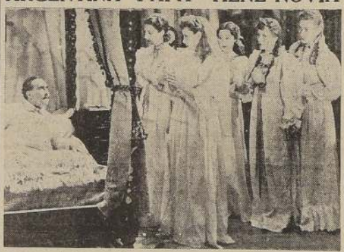
Un papel de gran lucimiento desma, en la producción argentina "Papa tiene novia", una comedia musical evocativa, del sello EPA, y que distribuye Band y Salas.

"CUANDO LOS HIJOS SE VAN..." la grandiosa obra que ha producido el nuevo y perfecto cine mexicano, bajo el prestigioso sello GROVAS-ORO FILMS, que en exhibiciones privadas ha merecido los más calurosos elogios, será estrenada en una premiere extraordinaria la noche del lunes próximo en el Teatro Santiago.