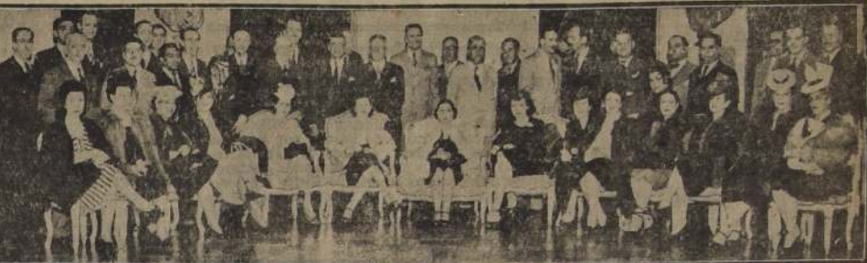
Asistentes al cocktail ofrecido en el Hotel Carrera por la artista española Conchita Piquer en honor de la prensa de la capital.