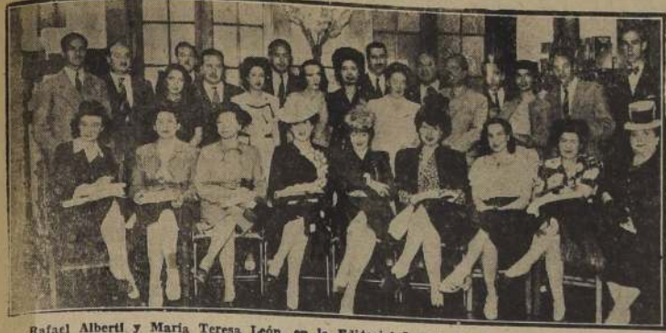
Rafael Alberti y María Teresa León, en la Editorial Losada, donde estuvieron firmando autógrafos.