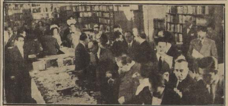
Durante la inauguración del nuevo local de la Librería "Seneca".