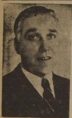
Excmo. señor Alfredo Duhalde de Vázquez.

EN UN ALMUERZO POPULAR QUE SE EFECTUARA A LAS 13 HORAS, EN EL ESTADIO NACIONAL. — SE LE HARA ENTREGA DE LA MEDALLA AL MERITO DEPORTIVO. COMO TAMBIEN AL MINISTRO DE HACIENDA, SEÑOR PABLO RAMIREZ; INTENDENTE DE SANTIAGO, SEÑOR WASHINGTON BANNEN; ALCALDE, SEÑOR GALVARINO GALLARDO, Y A DESTACADOS SOCIOS DE LA ENTIDAD ALBA. — ADHESION DE LA "U"