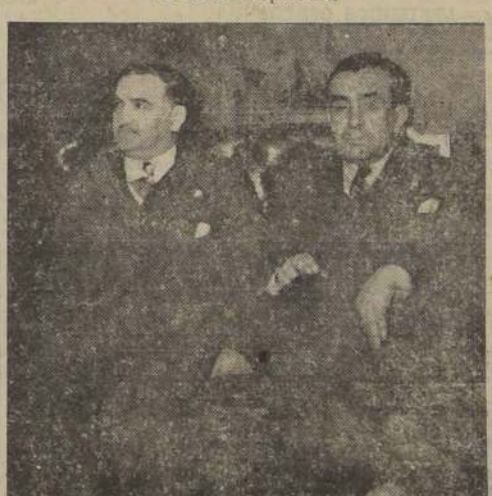
El Alcalde de Concepción y el secretario de la Municipalidad durante su visita a "LA NACION"

A mediodía de hoy visitará a S. E. el Presidente de la República