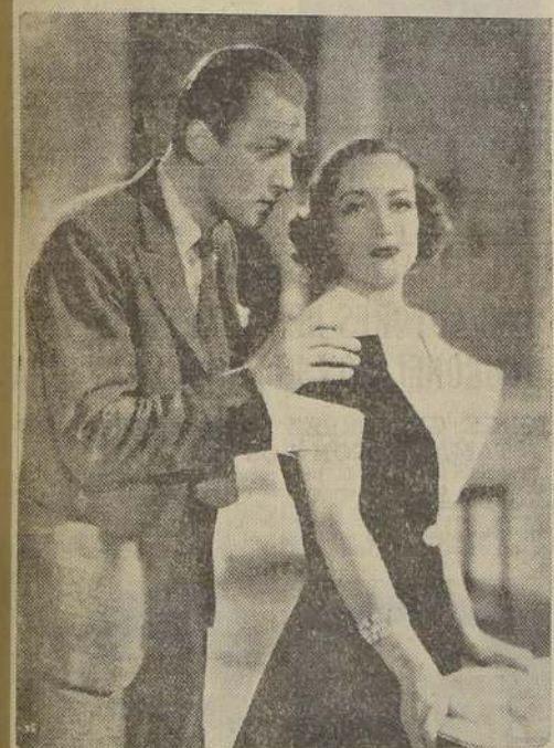
Joan Crawford con su nuevo galán, Brian Aherne, en "Yo vivo mi vida", que estrena hoy el Splendid

La empresa chilena Condor, anuncia para el viernes próximo uno de los beneficios más simpáticos, se trata de las segundas tipies del Balmaceda, artistas que han desarrollado a lo largo de una temporada de más de un año, un trabajo digno de todos los aplausos.