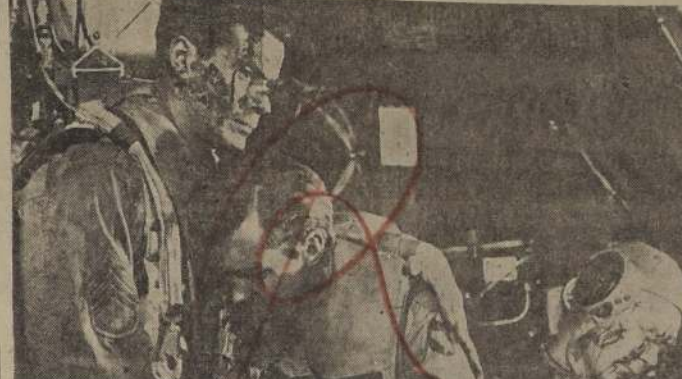
Una escena de gran realismo de "ALAS SOBRE EL PACIFICO", epopeya de las super-fortalezas n-29, que ha despertado mucho interés y que se estrena mañana en la noche en el Teatro Plaza en una función dedicada a la Fuerza Aérea. Los protagonistas son: Wendell Corey, Forrest Tucker, Phil Harris y Walter Brennan.