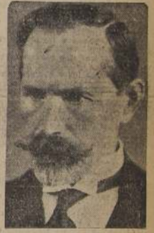
S. E. Antanas Smetona, Presidente de Lituania.