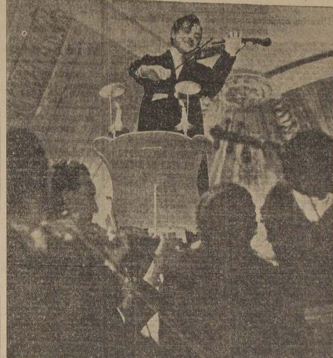
Fernand Gravet, interpretando el rol de JOHANN STRAUSS, dirige la famosa y alegre "Polka", en una de las escenas maravillosas de esta notable película que, bajo el título de "EL GRAN VALS", revive la alegría y el romance de la vieja Viena Imperial.

Maravillosa producción "EL GRAN VALS", de Metro-Goldwyn-Mayer, que estrenará el Teatro Metro, ha gestado la idea para poder realizar esta original competencia.— El vals vuelve bajo las melodías inolvidables de Johann Strauss, el famoso compositor vienés, cuya vida apasionada, rebelde y artística, relata este nuevo film