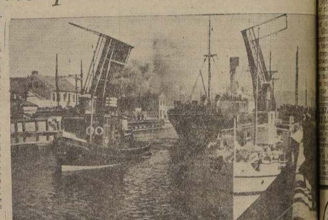
Vista del puerto de Memel, el más importante de Lituania y de gran actividad comercial.

del momento, no sólo no tiene conocimiento alguno del interés mundial en la probabilidad de la absorción de Memei por el Reich, sino que solamente hoy día supo de la visita del ministro de Relaciones Lituanas Urbsys a von Ribbentrop, en un parco anuncio de la DRB que no mencionaba los asuntos discutidos. Es de presumir que lo primero que se sepa del último "análisis" sea el anuncio triunfante de la prensa de todo el Reich, diciendo que Hitler ha "devuelto a la patria" otros 150.000 alemanes.