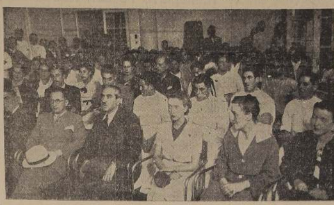
Asistentes al acto de ayer en el Instituto Traumatológico

La Escuela atenderá al personal del servicio y auxiliar, como igualmente a los accidentes.