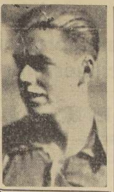
Asociación de Football de Santiago