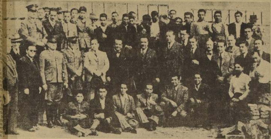
Ministro del Interior, el Intendente de O'Higgins, Jefes de Carabineros y otros invitados a la Fiesta de los Tijerales, acompañados de un grupo de obreros que trabajan en la construcción de la Población.