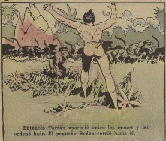
Entonces Tarzán apareció entre los monos y les ordenó huir. El pequeño Bodan corrió hacia él.