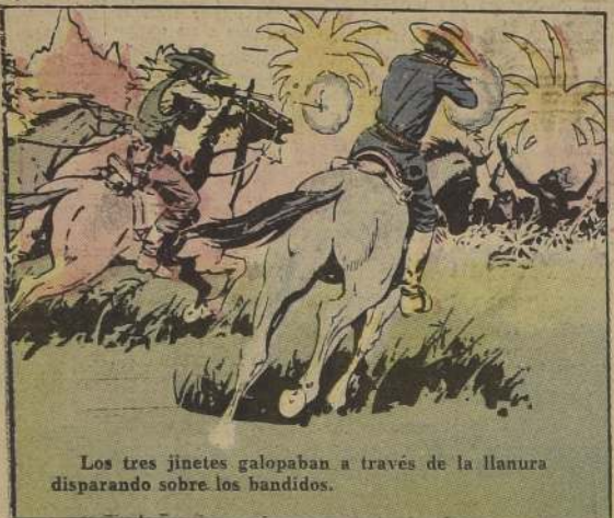
Los tres jinetes galopaban a través de la llanura disparando sobre los bandidos.