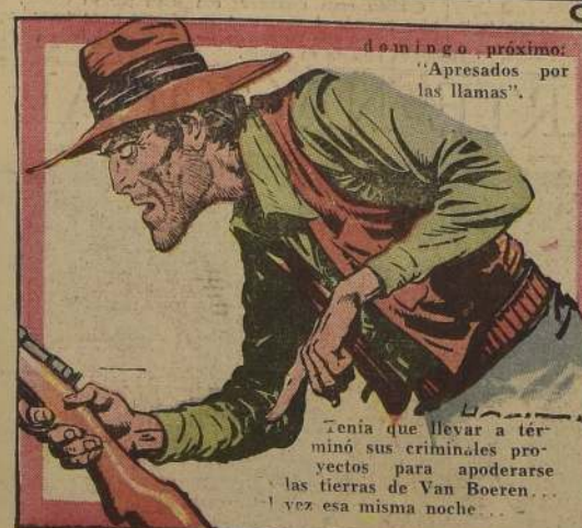
domingo próximo: "Apresados por las llamas".