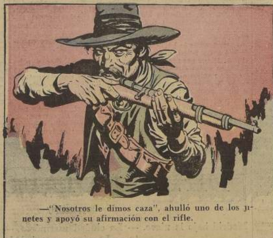
—"Nosotros le dimos caza", ahulló uno de los jinetes y apoyó su afirmación con el rifle.