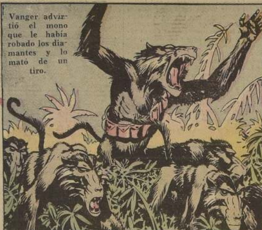
Vanger advirtió el mono que le había robado los diamantes y lo mató de un tiro.