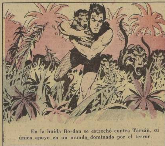
En la huida Bo-dan se estrechó contra Tarzán, su único apoyo en un mundo dominado por el terror.