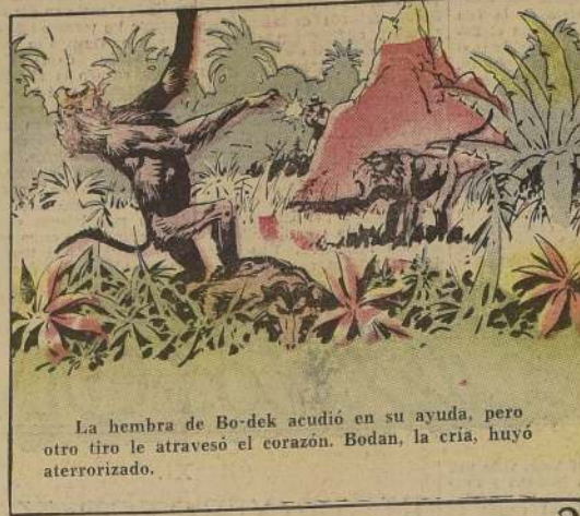
La hembra de Bo-dan acudió en su ayuda, pero otro tiro le atravesó el corazón. Bodan, la cría, huyó aterrorizado.