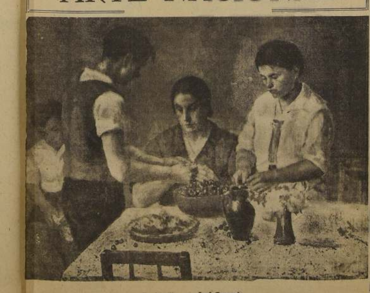
En familia, por José Caracci.