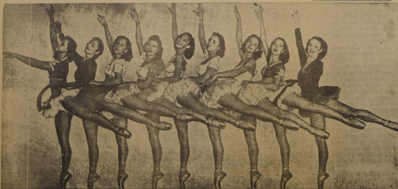
La danza rítmica, requiere condiciones especiales de agilidad, perfección física y un largo aprendizaje. En la fotografía aparece un grupo de bailarinas de este difícil arte, ensayando en el Center Theatre de Nueva York. ¡Famoso por sus espectáculos de ballets.