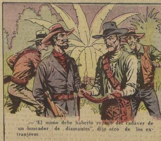
—"El mono debe haberlo robado del cadáver de un buscador de diamantes", dijo otro de los extranjeros.