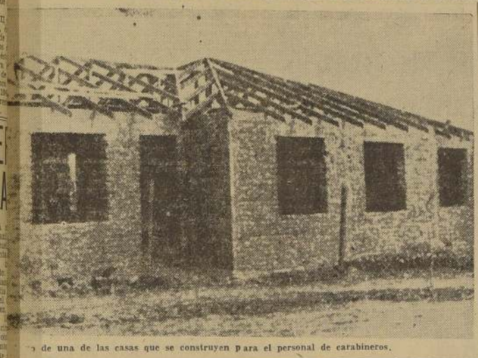
Una de las casas que se construyen para el personal de carabineros.