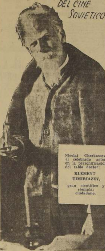
Nicolai Cherkasov, el celebrado actor, en la personificación del sabio doctor: KLEMENT TIMIRIAZEV, gran científico y ejemplar ciudadano.