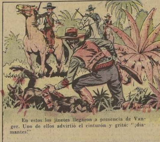
En estos los jinetes llegaron a presencia de Vanger. Uno de ellos advirtió el cinturón y gritó: "¡diamantes!"