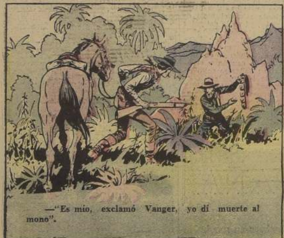
—"Es mío, exclamó Vanger, yo di muerte al mono".