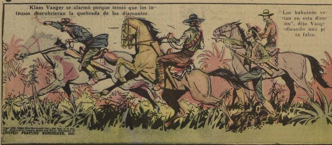
Klaas Vanger se alarmó porque temió que los intrusos descubrieran la quebrada de los diamantes.