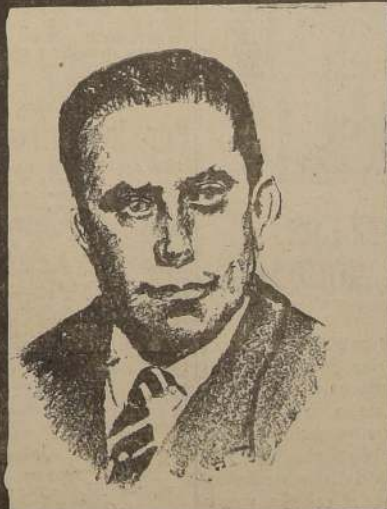
ENRIQUE CAÑAS FLORES ESPADA FISCALIZADORA EN LA POLÍTICA Y EN LA EDUCACIÓN.