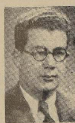
Figura en una de las últimas ubicaciones de la lista de Izquierda. Merece llegar a la Cámara, porque es un hombre joven, capaz y valiente, que en el Municipio HA CUMPLIDO CON LA CIUDAD. Necesita que el pueblo le marque sus votos de preferencia.

Candidato a diputado del pueblo de Santiago.