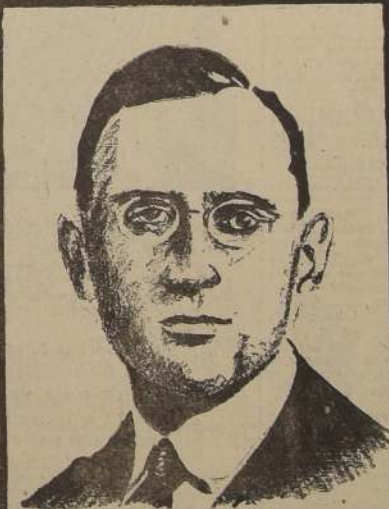
GMO. GONZALEZ PRATS JUVENTUD Y CRITERIO: UN IDEAL DE CONSTRUCTIVA RENOVACIÓN.