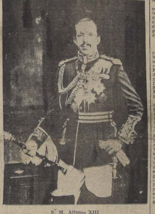
S. M. Alfonso XIII

BIOGRAFIA DEL EX SOBERANO La familia real de España se reunirá en una misa de memoria en una iglesia cercana al lugar del fallecimiento del rey. El ex monarca murió en un sillon especial, sostenido por tres colinas purpuras, porque su es-