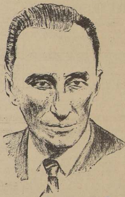
HORACIO WALKER LARRAIN FIGURA CUMBRE EN EL SENADO