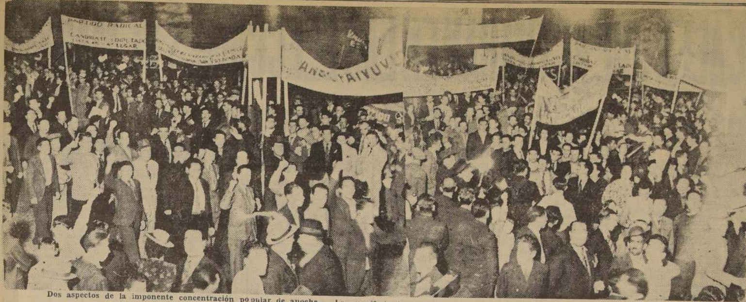
Dos aspectos de la imponente concentración popular de anoche. — Los manifestantes van llegando a la Avenida Bulnes.