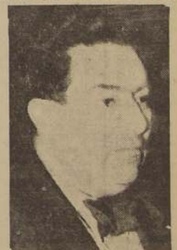
VOTE POR GERARDO LOPEZ LISTA N.º 6 — SEXTO LUGAR