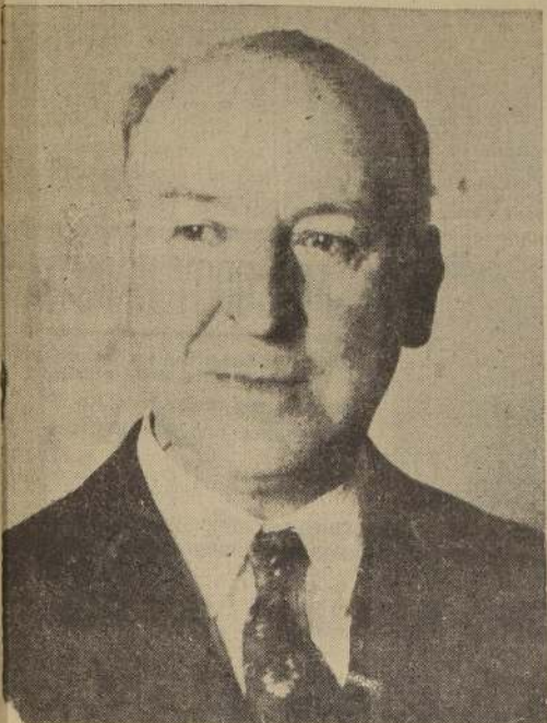
Marmaduke Grove V.