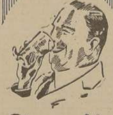
Ginger Ale NOBIS