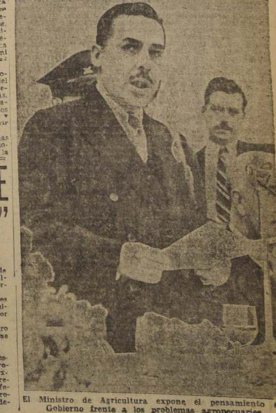
El Ministro de Agricultura expone el pensamiento del Gobierno frente a los problemas agropecuarios