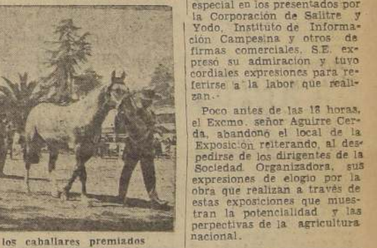
Durante el paseo de los caballos premiados

Intercalados entre los desfiles de animales premiados, se efectuó un concurso de