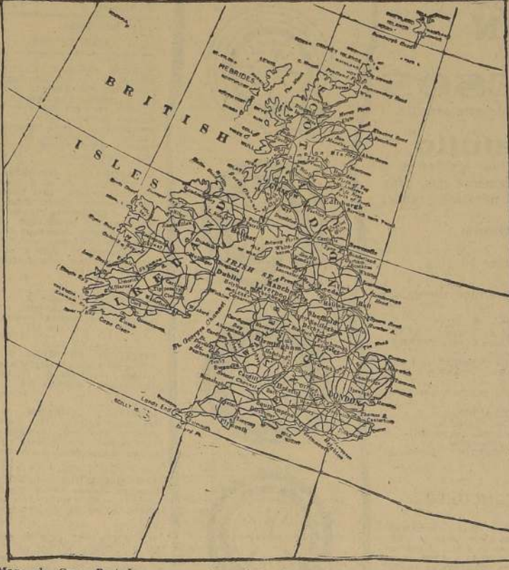
Mapa de Gran Bretaña, que muestra principalmente las costas orientales, que fueron visitadas ayer por los aviones alemanes. Las islas Orcadas quedan en el Norte de Escocia, arriba; el Condado de Kent se halla un poco al Norte de Londres. Entre esos dos puntos volaron los alemanes

ANGORA, 17. (U. P.). — El Primer Ministro Saydam, declaró que habían fracasado las conversaciones ruso-soviéticas, que Rusia había presentado al Ministro turco de Relaciones Exteriores, Sarajoglu, proposiciones absolutamente diferentes a aquellas que originalmente se propusieron para su discusión.