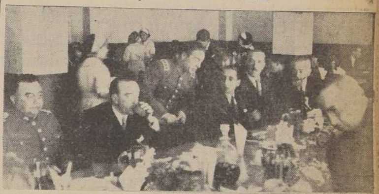
Un aspecto de la inauguración del tercer Restaurant Popular.

Fue inaugurado ayer en la calle Politeama N.º 76, con asistencia del Ministro del Trabajo, Intendente de Santiago, autoridades y numerosos invitados