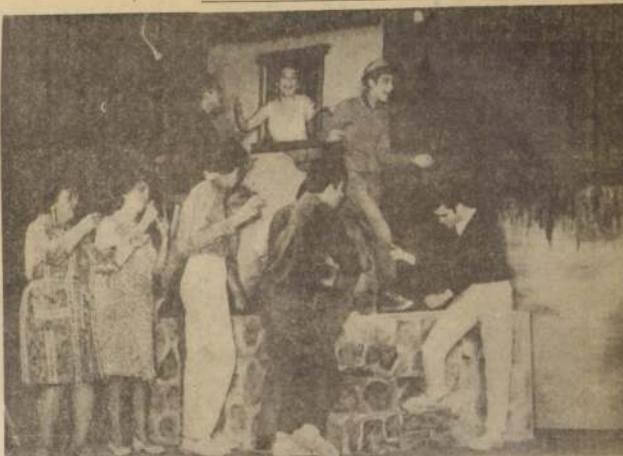
VALPARAISO.— V FESTIVAL DE TEATRO AFICIONADO EN VÍA.— Continúa desarrollándose con gran éxito en Vía del Mar el V Festival de Teatro Aficionado Independiente, que auspician la Asociación Nacional de Egresados de la U. de Chile y la Municipalidad del balneario. Conjuntos llegados desde todos los puntos del país se presentan diariamente en la Quinta Vergara, y el público ha sabido responder a esta iniciativa de acercar las manifestaciones teatrales al pueblo. En el grabado una de las escenificaciones presentadas en el Festival por el Conjunto de Teatro de Profesores de Valparaíso, en la obra "La señora Cueto".