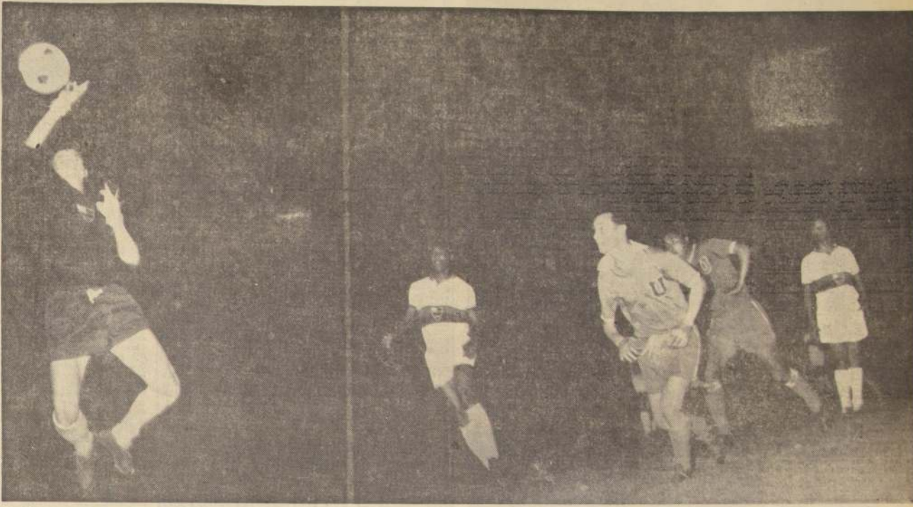
La delantera de la "U" lució mucho más velocidad en el 2º a su cuadro al dilatar excesivamente el juego. Justamente en este período, cuando Araya reemplazó a Coll. El entrecara argentino, buen jugador de fútbol, pero un poco lento, restó peligrosidad a Coll el que amaga un poco al golero carioca, llevando atrás a Campos y frente a Luis Carlos y Ananías, eficientes defensores.

En el vigésimo cuarto tiempo, reanudado a los 14 minutos, Paulo, con un disparo bajo y preciso, logró el vigésimo cuarto tanto, tras un pase de Paulo.