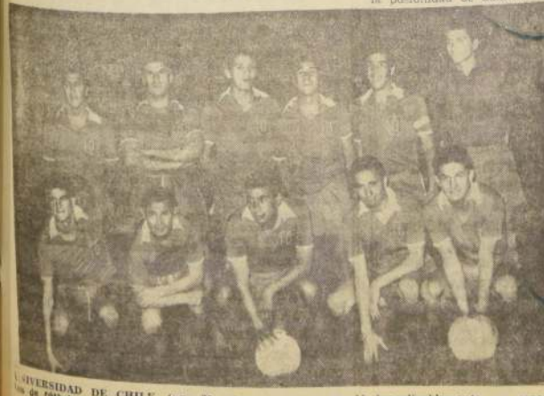
UNIVERSIDAD DE CHILE, tuvo 25 minutos de fútbol de mucha jerarquía, pero luego se quedó inexplicablemente, en especial su ofensiva.