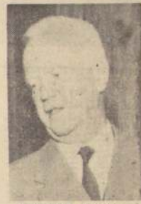
HEINRICH LÜBKE, Presidente de Alemania Occidental.

BONN, 15. — (UPI). — El Presidente de Alemania occidental, Heinrich Lübke, hará un viaje por la América Latina a fines del mes de abril y principios de mayo, se anunció esta mañana en su oficina. Lübke, dice el anuncio, visitará Argentina, Brasil, Chile y Perú. Será el primer viaje a la América Latina que realiza un Jefe de Estado de Alemania occidental desde la fundación de la República Federal en 1949. Se considera el anuncio como un indicio de que Lübke también ha decidido presentarse nuevamente como candidato a la Presidencia en las próximas elecciones. Su mandato expira en septiembre. Se tiene entendido que Lübke, ha estado demostrando el anuncio de su viaje a la América Latina hasta decidir si iba a presentarse como candidato para un segundo período. Sus asesores consideran que podría haber sido poco apropiado para él emprender el viaje si no tenía el propósito de presentarse como candidato a la reelección. La reelección de Lübke es segura si se presenta como candidato. El Presidente volvió recientemente de un viaje de unos meses a Irán, Indonesia, Japón y Las Filipinas. El ex Canciller Konrad Adenauer también prometió a algunas personas que lo visitaron recientemente hacer el viaje por la América Latina, pero aún no ha decidido fecha para ello.