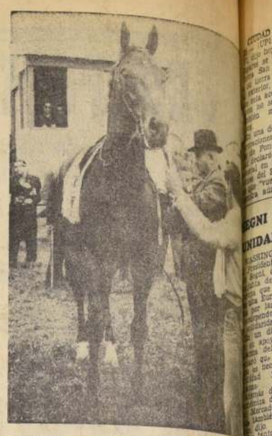
SORTILEGE correrá "El Derby" y por algo será, tumbado a los "carreles". Aquí se le ve alistaado poco antes de su apriete.