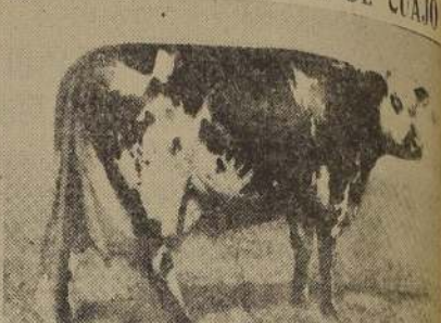
La vaca normanda "Reineta", de siete años de edad, producción controlada de 7,236 kgs. de leche, durante el año 1939

Se compra en el Matadero el cuajar de un cabrito o de una ternera. El cuajar es una de las partes del estómago de los rumiantes. Se varia en un plato el trozo y se divide en cuajal, se le añade un litro de leche, 200 gramos de harina, 2 gramos de sal en polvo y una cantidad de levadura de pan del tamaño de una nuez. Se agita la mezcla hasta diluir bien y se pasa por un paño o tamiz, en seguida se lava repetidas veces el cuajar, después de haberlo espolvoreado por dentro con sal, se vierte en la preparación anterior, se ata el orificio y se cuece al baño María.