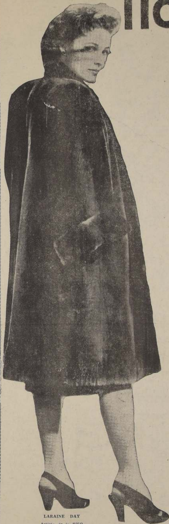
LARAIN DAY Artista de la RKO Pictures.

Los maravillosos modelos en pieles finas que presenta la casa NAMUR para la temporada que se inicia, llaman poderosamente la atención, no sólo por su suntuosidad, sino también por la gran calidad de los mismos y la perfecta combinación de las pieles que en ellos se emplean.