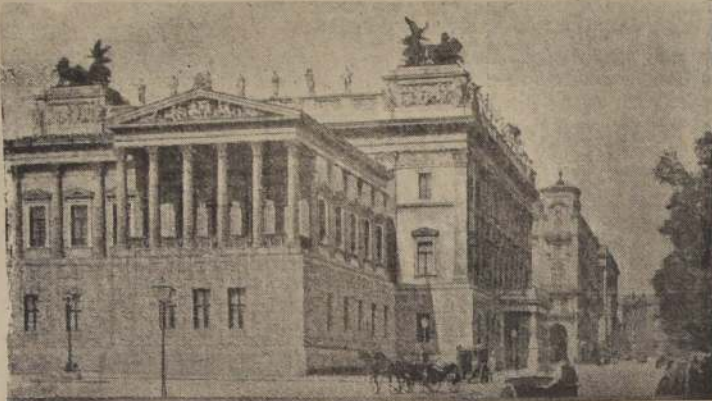
Edificio del Parlamento en Viena

Después de los últimos momentos de la batalla, el frente dan detalles de los últimos mo-