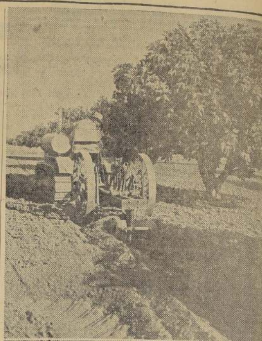
Los llamados "tractores hortícolas", prestan en los huertos de árboles frutales los mismos servicios que los tractores de gran potencia proporcionan en los campos de cereales, al paso que las gradas, arados de discos y varios otros aperos de cierto tipo, producen cada vez mayores beneficios pecuniarios en la ejecución de dichos trabajos.

1371 - Huérfanos - 1381 o a sus Agentes en todo el país Pág. Agr.-X