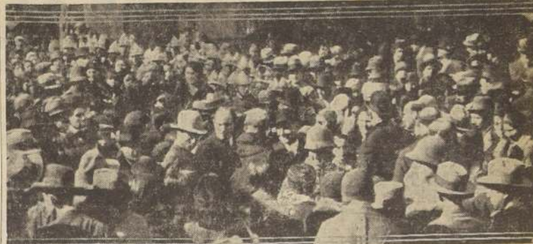
Durante el Te-Deum de ayer en Lourdes.

en acción de gracias con motivo de las fiestas del 14 de julio