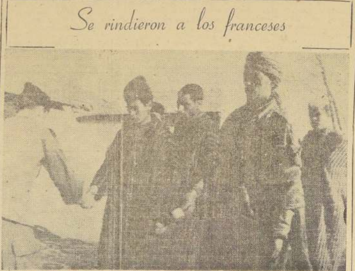
AIN-BEIDA (ARGELIA).— Temporalmente detenidos en un campo de concentración, aparece aquí un grupo que forman parte de 156 rebeldes, que se rindieron a las fuerzas francesas en la frontera tunecina, en lo que se ha conside-