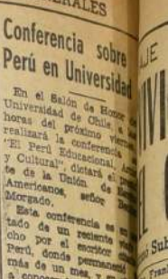
Conferencia sobre Perú en Universidad

Tanto la inauguración de la nueva oficina, como el cambio de ornamentos de la sucursal, constituyen un señalado esfuerzo que hace la Superioridad del Banco de Crédito e Inversiones, en favor del desarrollo y progreso de la comuna de Ñuola.