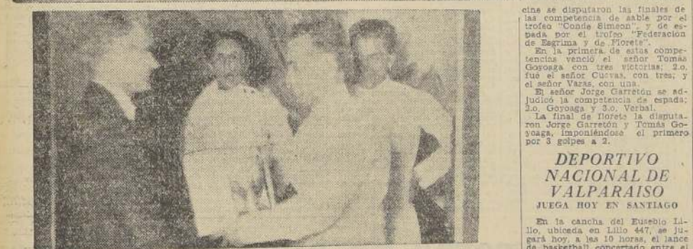
El Conde Simón, Adicto Militar francés, rodeado de los esgrimistas que participaron en la Gala. Abajo, el distinguido diplomático que preside el evento en el velódromo de Nuñoa.

Un buen éxito para la Federación Nacional constituyó la gala de esgrima que se llevó a efecto el sábado último en el Teatro Real Victoria como número oficial del programa de fiestas patrias.