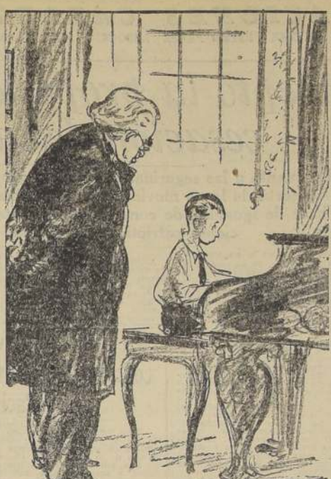
EL PROFESOR. — Jovencito... Me temo que algo ajeno a la música se está apoderando de su alma...

Nopuede haber belleza completa sin una buena dentadura. Para conservarla sana y brillante use PASTA ESMALTINA.