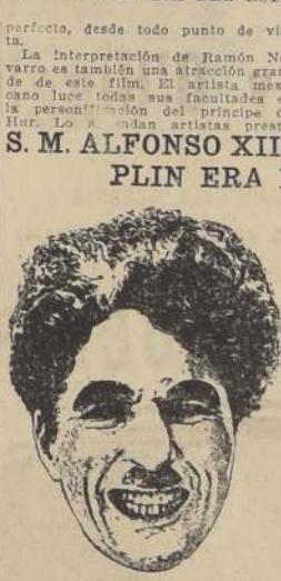
Uno de los números recientes de "El Imparcial" de Madrid da cuenta del estreno de "El circo" de Chaplin en los cines Real Cinema y Príncipe Alfonso. Este suceso tuvo una trascendencia social y artística de enorme resonancia.

La obra tiene ambientes muy variados que dan mayor atracción al film. En los actos finales desfilaron por los teatros de variedad de París y veremos a la Baker imponerse como danzarina única.