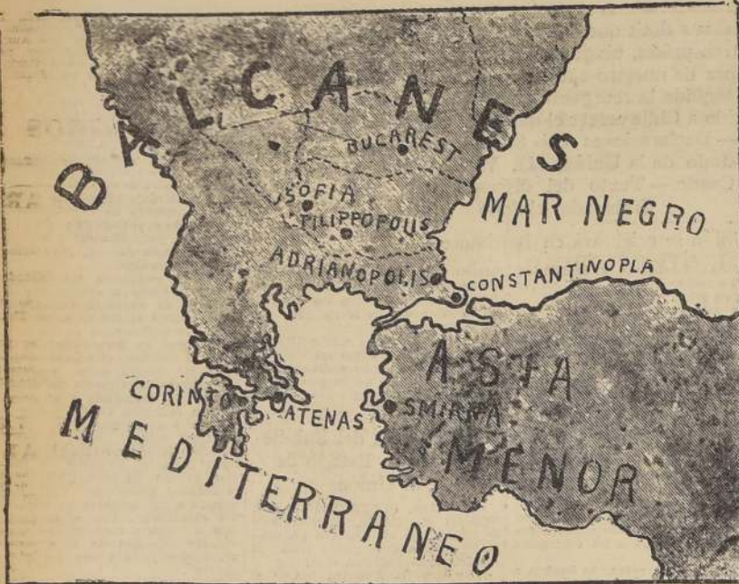
Mapa de las regiones afectadas por los fenómenos

Los países de la península balcánica y algunas regiones de Asia Menor han constituido últimamente el foco de una larga serie de temblores que se han ido sucediendo con cortos intervalos. Los movimientos han devastado casi por completo algunas regiones de Bulgaria y destruido enteramente a la antigua e histórica ciudad de Corinto en Grecia. Según las in-