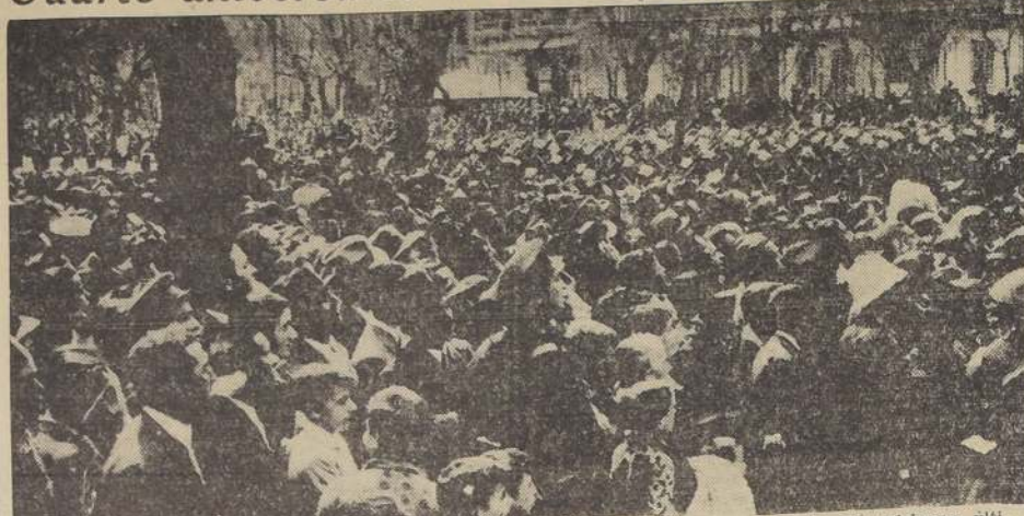
Tropas de la guarnición de Madrid, desfilando por las calles de la capital, con ocasión de celebrarse últimamente el 4.º aniversario del establecimiento de la segunda República Española