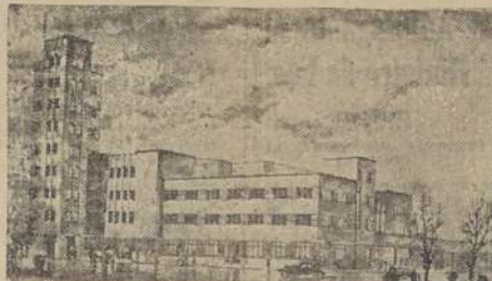
Maquette de la nueva estación provisoria del Puerto