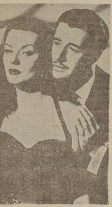
Hazel Brooks y Don Ameche animan esta escena de "Sueña, amor mío", la comedia que distribuye Aristarqui Unidos y que produce Mary Pickford. Este film inicia hoy su segunda semana de exhibiciones.