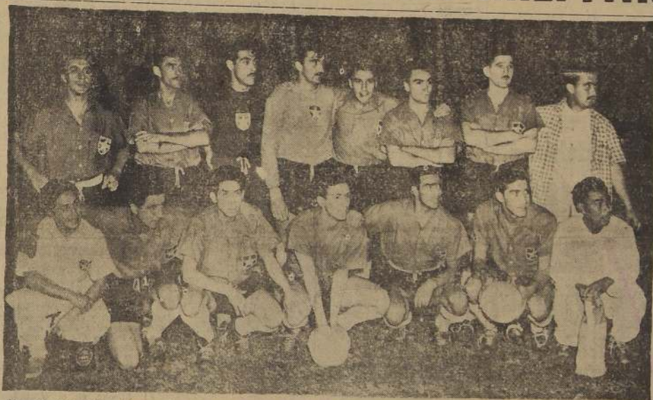
EQUIPO CHILENO.— Que cumple esta noche, en el Estadio de Vasco da Gama, de Río de Janeiro, su cuarta presentación en el Campeonato Sudamericano de Fútbol. Los chilenos confían en el resultado de este compromiso.

Los carabineros de la zona se dedicaron inmediatamente a la búsqueda de ambos ocupantes del avión, no pudiendo precisarse hasta el momento de esta transmisión (1 hora de hoy), el lugar exacto en que cayó el avión, presumiéndose que debe ser en las cercanías de Rancagua.— (SOFANOR VIDAL, Corresponsal).