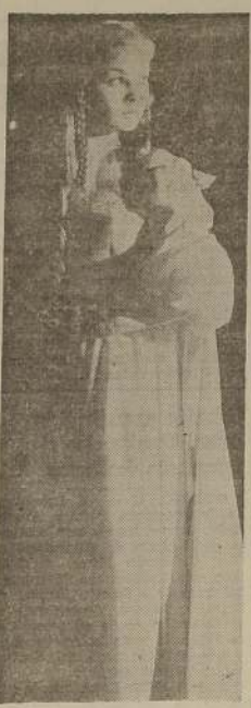
La Ofelia de la pantalla, Jean Simmons en la presentación cine matográfica de "Hamlet", de William Shakespeare, realizada por Laurence Olivier.