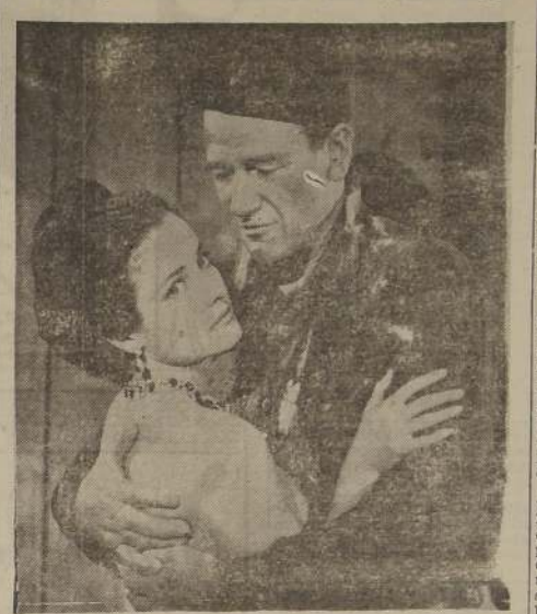
La bella y tierna Laraine Day y el intrépido John Wayne, forman la nueva pareja de la ciudad del cine.

Este drama trae a los espectadores la visión apasionante de la constante lucha que ha librado el hombre con los elementos de la naturaleza. "Hombres de Presa", es la superproducción RKO Radio-Pictures, que ha captado, con todo su intenso dramatismo, los esfuerzos y sacrificios que cuesta la construcción de un ferrocarril a través de la Cordillera de Los Andes. John Wayne y Laraine Day, forman la nueva pareja romántica del cine, protagonizando las más dramáticas escenas de esta película.