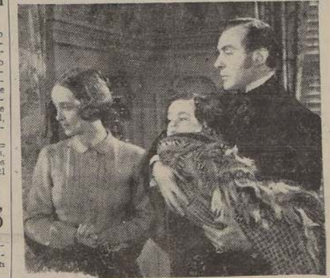
Bette Davis y Charles Boyer, en una escena de la producción "El cielo y tú", que la Warner Bros. dará a conocer hoy, según lo anuncia, en los Teatros Real, Baquedano y Santiago. Esta gran producción es una de las realizaciones cinematográficas de más alto vuelo artístico de la actual temporada, y se exhibirá hoy, en "premiere", para ser estrenada en el mes próximo.