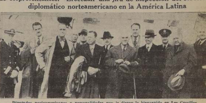
Diputados norteamericanos y personalidades que le dieron la bienvenida en Los Cerrillos

Forman la Subcomisión de Comité de Presupuestos de la Cámara de Representantes.— Efectúan una jira de inspección del servicio diplomático norteamericano en la América Latina