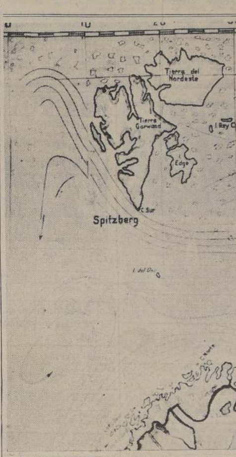
El archipiélago de Spitzberg se halla situado en pleno Océano Glacial Ártico, más o menos a los 76 grados 25 minutos a 80 grados 50 minutos de latitud norte y 10 a 32 grados de longitud este del meridiano de Greenwich. Se compone de un número de pequeñas islas e isletas y de cinco islas grandes, siendo la principal de ellas la denominada Spitzberg occidental. En esta última hay varias minas de carbón cuyos productos se exportan en grandes cantidades durante los meses del verano. La más importante de esas minas es la situada en la bahía de Advent.

El 8 (U. P.).— Berlín anoche en carne pro- pia sufrió el más vio- lento de los bombardeos de la guerra actual. Los ataques de aviones de guerra británicos contra la ciudad de Berlín, durante la noche del 8 al 9 de septiembre, causaron grandes daños y muchos incendios. Se estima que el daño material en la ciudad de Berlín puede ser de hasta 100 millones de marcos.