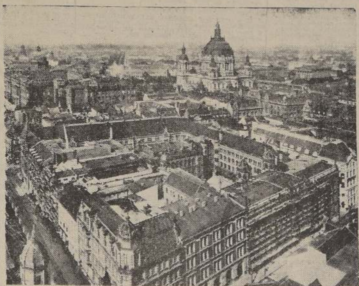
Panorama de la parte central de Berlín, gravemente dañada durante el violentísimo bombardeo realizado ayer por grandes formaciones aéreas británicas.

El 8 (U. P.).— Berlín anoche en carne pro- pia sufrió el más vio- lento de los bombardeos de la guerra actual. Los ataques de aviones de guerra británicos contra la ciudad de Berlín, durante la noche del 8 al 9 de septiembre, causaron grandes daños y muchos incendios. Se estima que el daño material en la ciudad de Berlín puede ser de hasta 100 millones de marcos.