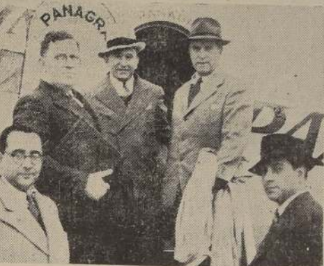
Delegados de Estados Unidos al Congreso Interamericano de Municipios, que llegaron ayer

de la delegación es- e que se compone e 15 personas, llega- on ayer mañana y