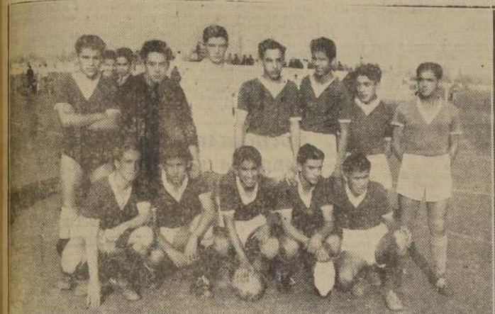
Equipo del Liceo Barros Borgoño que igualó a 0 gol con el equipo del L. de Aplicación