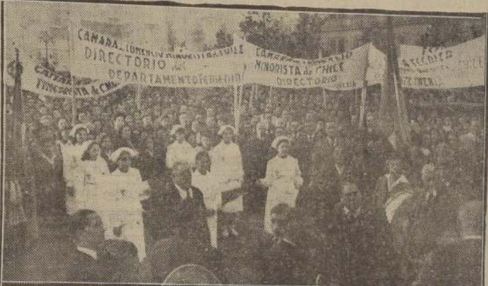
Un aspecto de las Seccionales y del público participante en el comicio realizado ayer por la Cámara de Comercio Minorista

Ayer se realizó un desfile y concentración de sus miembros