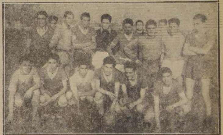
Buena presentación cumplió el cuadro del Amunátegui en su empate a un tanto.