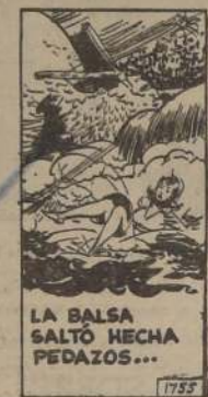
LA BALSA SALTÓ HECHA PEDAZOS...