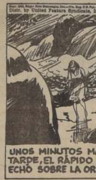
UNOS MINUTOS MÁS TARDE, EL RÁPIDO LA ECHÓ SOBRE LA ORILLA.