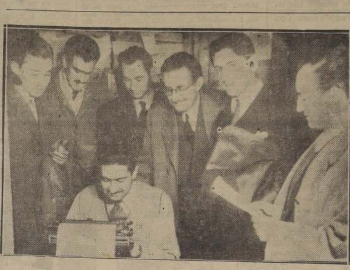
Los alumnos de la Universidad de Chile y los de la Escuela de Leyes de la Católica iniciarán hoy a mediodía un paro de 48 horas, solidarizando con el movimiento de sus compañeros de Concepción. Dirigentes universitarios visitaron anoche LA NACION; aquí los vemos dando a conocer sus impresiones a uno de nuestros reporteros

Fue acordada por solidaridad con los alumnos de la U. de Concepción