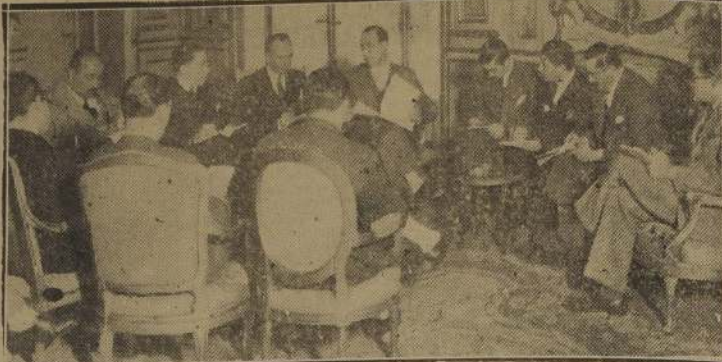
El Canciller Bramuglia informa a la prensa acerca de las medidas adoptadas por Argentina contra los aviones paraguayos.