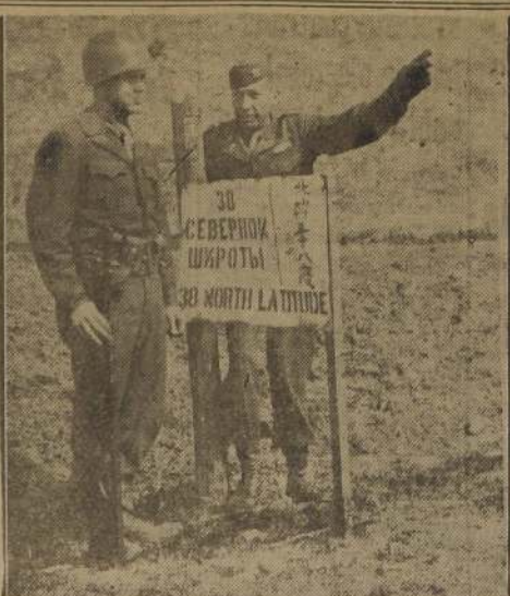
Dos centinelas de las fuerzas americanas se encuentran junto al jón que señala el límite de las zonas rusas y americanas en la península de Corea.