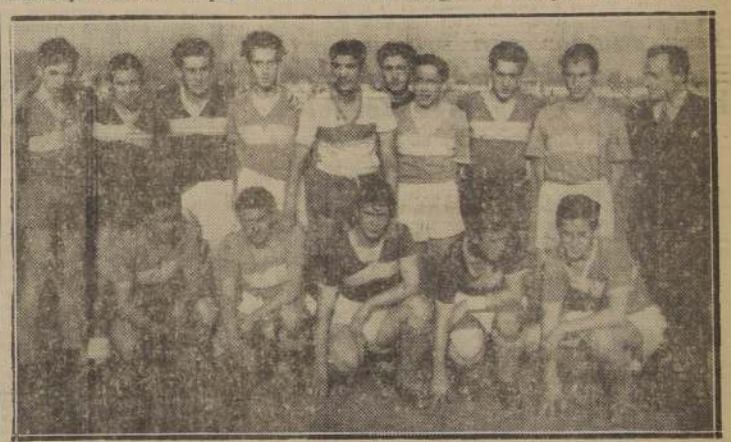
Equipo del Liceo Lastarria que perdió por 4 a 2 en su partido oficial con el V. Letelier