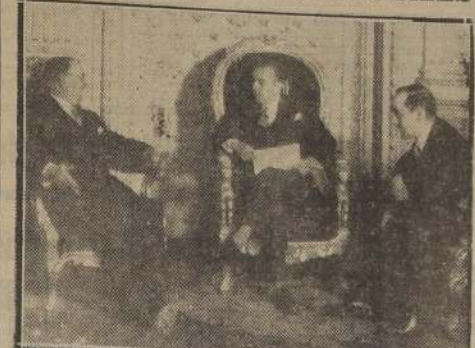
S. E. y el Cancellero conversan con el Embajador de Cuba, después de la entrega de las credenciales