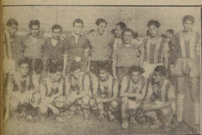
Final triunfo consiguió este cuadro del I. Comercial N.º 2 sobre el Liceo N.º 6, serie B.