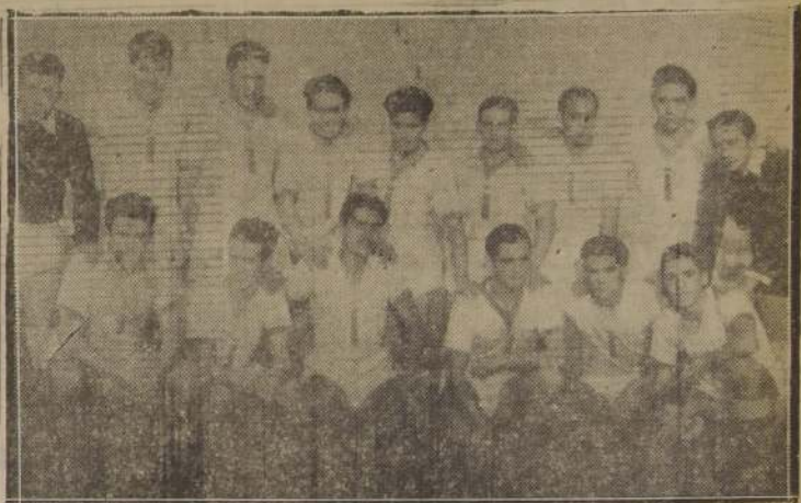
Elenco del Internado Nacional Barros Arana, vencedor por 4 a 2 del Instituto Nacional