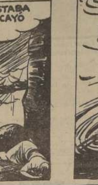
DEBAJO DEL AGUA, LA RESISTENCIA DE LA FIERA SE DEBILITÓ.