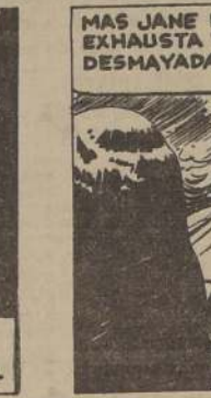
MAS JANE ESTABA EXHAUSTA Y CAYÓ DESMAYADA.