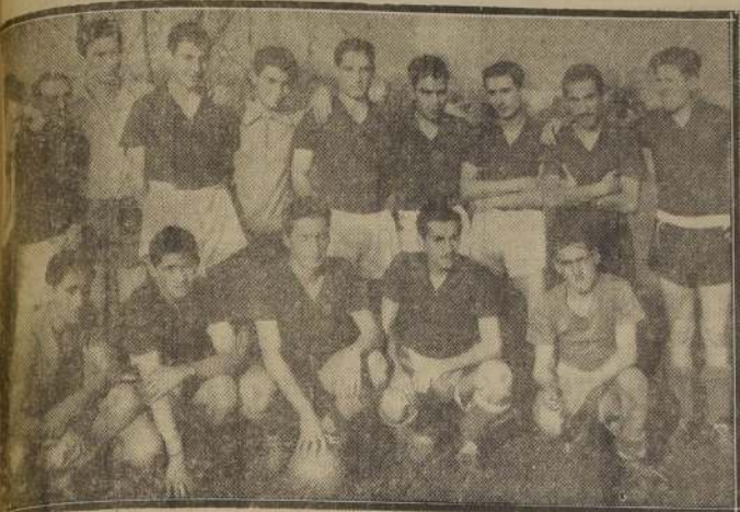
Representación del Instituto Superior de Comercio, uno de los teams más eficientes