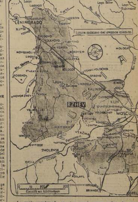
La parte sombreada, en el presente mapa señala la zona reconquistada por los rusos.

ATENCION.... ATENCION!!! SE ACERCA el MOMENTO EN QUE UD. PODRÁ GANAR DIARIAMENTE $ 100.= CONTESTANDO a los LLAMADOS TELEFONICOS "SEGUROL" en VEZ de ALÓ.