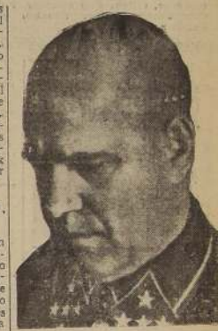
General Zhukov, que comanda el ejército ruso que avanza hacia Smolensk.

Los ejércitos de Zhukov son los que cruzaron el río Dvina, al sudoeste de Bryansk, a principios de mes, y continuaron avanzando hacia el noreste, teniendo a Smolensk como objetivo. Empleando cosacos y artillería tirada por caballos, a través del barro que cubre la mayor parte del terreno en esa zona, las fuerzas rusas se abrieron paso sucesivamente a través de las líneas alemanas y ahora se han aproximado a la ciudad de Smolensk lo suficiente como para poder cañonearla.