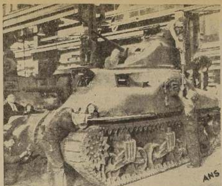
NUEVO TIPO DE TANQUE PARA EL EJERCITO NORTEAMERICANO. — El más moderno de los tanques norteamericanos, fundido en acero en vez de estar hecho como los anteriores, con chapas remachadas entre sí. A la izquierda del nuevo modelo puede verse el antiguo.

En los círculos belgas de esta capital se manifestó que se tiene noticia de que las autoridades alemanas de ocupación ordenaron la evacuación de las granjas existentes en el distrito abarcado por los ríos Sambre y Meuse, en Bélgica, y se braron minas en diversos lugares del país, entre ellos Louvain-la-Neuve, Gervin, Fleurbaey y Walcourt.